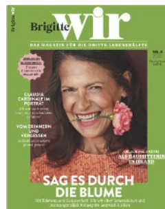
Produktion: Birgit Potzkai; Haare + Make-up: Eva Hennings; Model: Silvia/Elbmodels