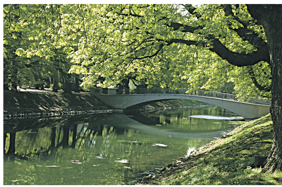
Mit Stil - Vom Aachener Weiher bis in den Stadtwald

Das regelmäßige Trockenlegen hört sich heute nach ökologischem Unsinn an, da durch diesen Eingriff in die Natur jedes Mal funktionierende Ökosysteme zerstört wurden, die erst nach langen Jahren wieder nachwachsen konnten. Doch die Bäche und kleinen Flüsse und ihre Wasserkraft wurden in früherer Zeit intensiv für Handwerk und Industrie genutzt. Wenn sie schließlich im Stadtgebiet Kölns ankamen, waren sie zu stinkenden Kloaken verkommen, die ein Leben in ihrer Nähe mehr als unangenehm machten. Das ist auch