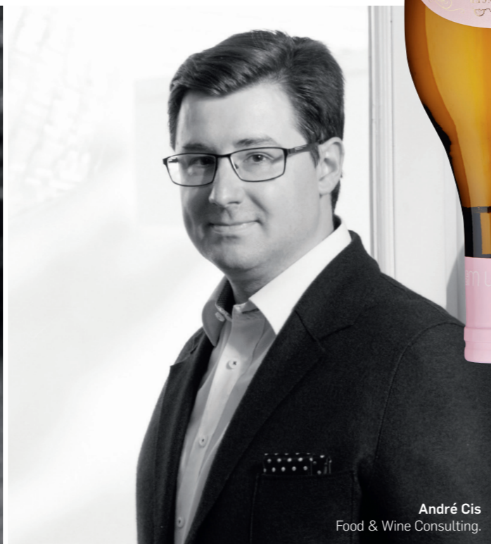
André Cis Food & Wine Consulting.