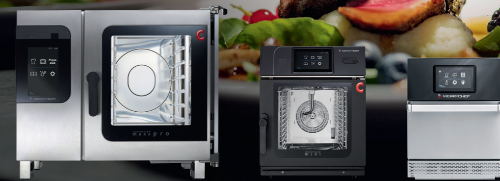
Convotherm maxx pro Kombidämpfer