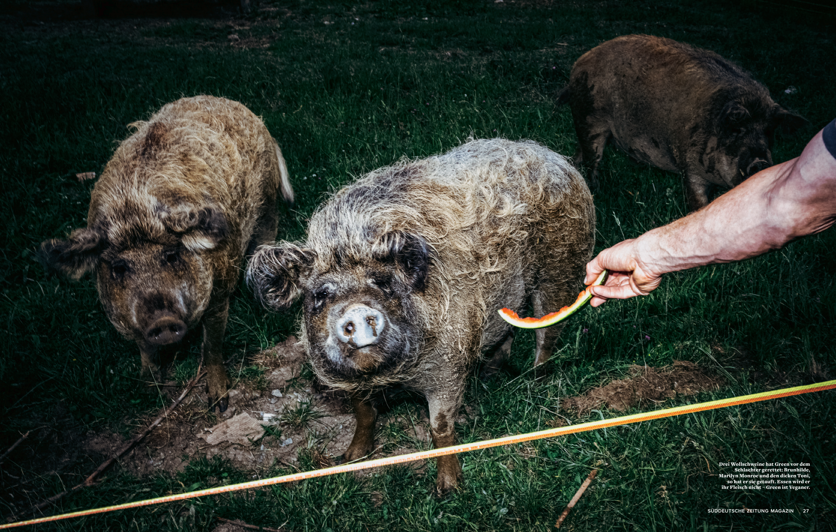
Drei Wollschweine hat Green vor dem Schlachter gerettet: Brunhilde, Marilyn Monroe und den dicken Toni, so hat er sie getauft. Essen wird er ihr Fleisch nicht - Green ist Veganer.