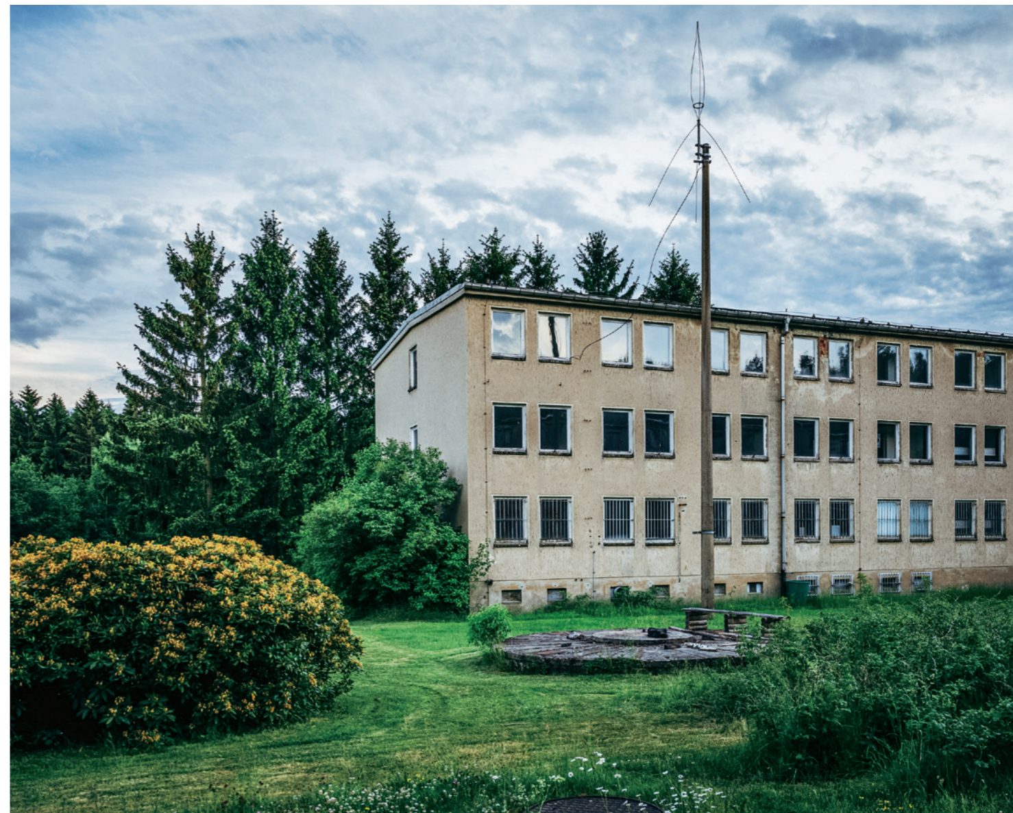
Das alte Kasernen-Gelände, das Green in Sachsen gekauft hat, umfasst einen Speisesaal und zwei große Baracken wie diese.

Doch er ist noch nicht am Ziel. Alle paar Monate radelt er zum Supermarkt, um Bratöl, Zucker und Kaffee zu kaufen. Damit aus seinen Äckern schneller fruchtbare Gärten werden, gibt er Pferdewirtschaft zur Erde, den er von Bauern aus der Umgebung erhält. Wenn ihn jemand mit einem Auto besucht, lässt er sich zum Baumarkt fahren oder holt Futtersäcke für die drei Wollschweine, die er vor dem Schlachter gerettet hat. Sie heißen Brunhilde, Marilyn Monroe und Fat Toni und sind eine Zumutung für seine Vision der Selbstversorgung. Er wollte eigentlich nur ein Ferkel adoptieren, doch er konnte die anderen nicht dem sicheren Tod überlassen. »Ich bin schon ein elendig dummer Veganer«, sagt Green. »Jedes Schwein frisst so viel wie drei Menschen.« In einigen Jahren könnte er auch für sie genug Futter anbauen. Doch er bezweifelt, dass der Kollaps der Gesellschaft