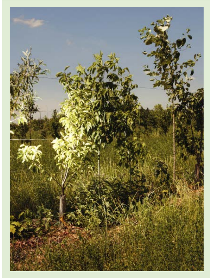
Modellhof: Mit Obstbäumen, Mischkulturen und Weidehaltung erprobt Benedikt Bösel (Foto r.) eine Landwirtschaft, die der Trockenheit gewachsen ist