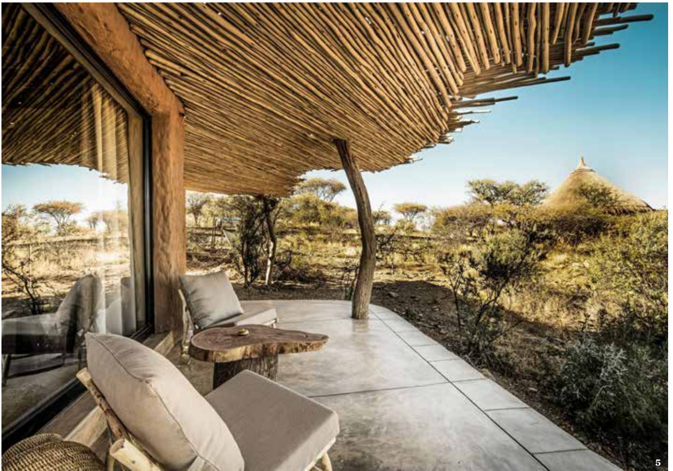
1. Morgen- und Abenddämmerung sind die spannendsten Wildlife-Zeiten. 2. In Namibia leben rund 23 000 Elefanten – im Gegensatz zu den meisten afrikanischen Ländern wächst die Population. 3. Mehr als Deko: Geflochtene Körbe dienen zur Lagerung von Korn. 4. In der „Zannier Sonop Lodge“ herrscht „Jenseits von Afrika“-Atmosphäre. 5. Panoramaterrasse: Die „Zannier Omaanda Lodge“, nur 30 Minuten von der Hauptstadt Windhuk entfernt

Spross der Getty-Familie gehört – gleicht einem Schmuckstück. Fast ein Jahr lang wurde sie renoviert, um mit viel Stein, Stahl und Glas mit der umliegenden Landschaft zu verschmelzen. Breite Fensterfronten signalisieren klar, wer hier der Protagonist ist: die Wüste und ihre Bewohner. Und so sitzt man nach Ausflügen zu den Höhlenmalereien der Ureinwohner San oder einer E-Bike-Tour auf der Terrasse, zu deren Füßen der Wind Sandkörner über die roséfarbene Ebene treibt. Lässt den Herzschlag herunterfahren und beobachtet die Zebras, Strauße und Antilopen, die nachmittags zum Wasserloch – oder zum Pool! – trotten, um ihren Durst zu stillen. Knapp drei Autostunden weiter südlich hat im Sommer 2019 die „Zannier Sonop Lodge“ eröffnet, inmitten riesiger Felsbrocken. Zehn Safari-Zelte im