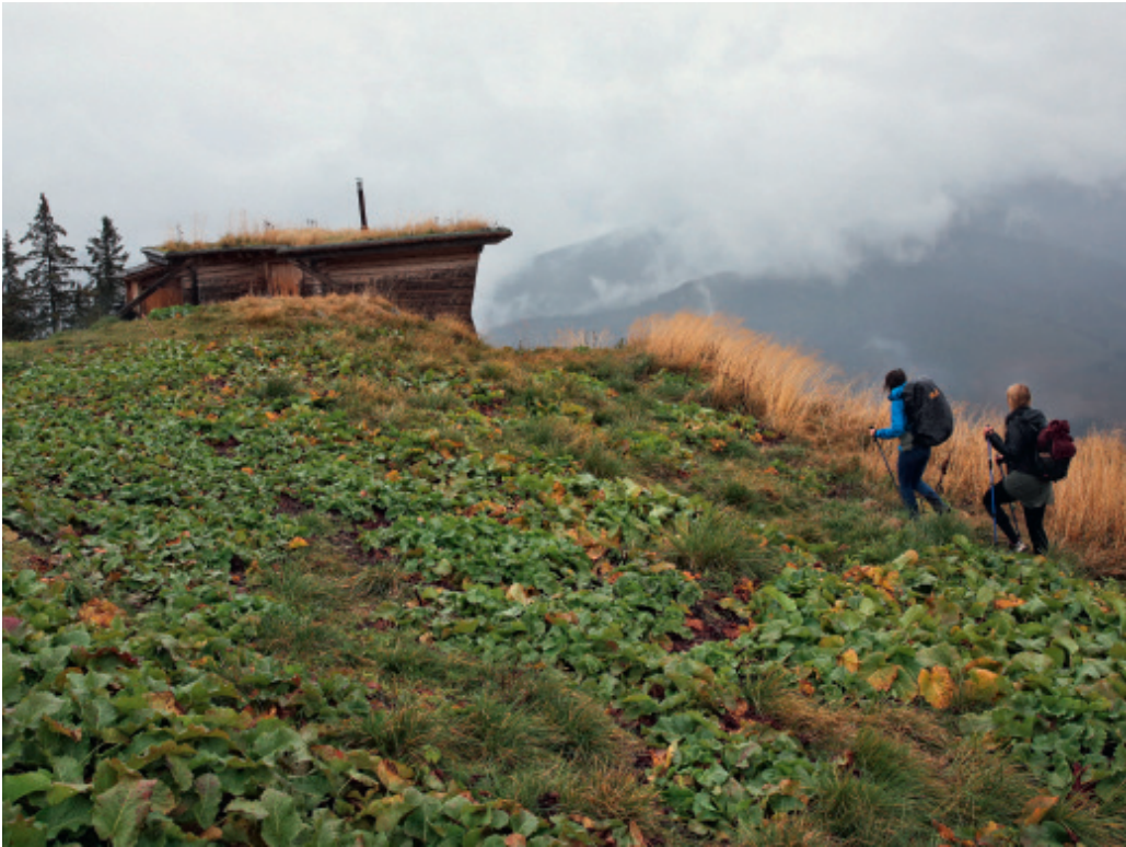
Unterwegs mit der «Ballerina der Berge» Simona Bordea zur Comisu-Hütte

Karpaten-Hirtenhunde. Eine Hündin liegt im Zwinger, ihre Welpen säugen an ihren Zitzen. Die Hütehunde werden zum Schutz der Schafherden kostenlos an die Schäfer der Făgăraș-Berge verteilt – damit sie die Herden vor Wölfe und Bären schützen.