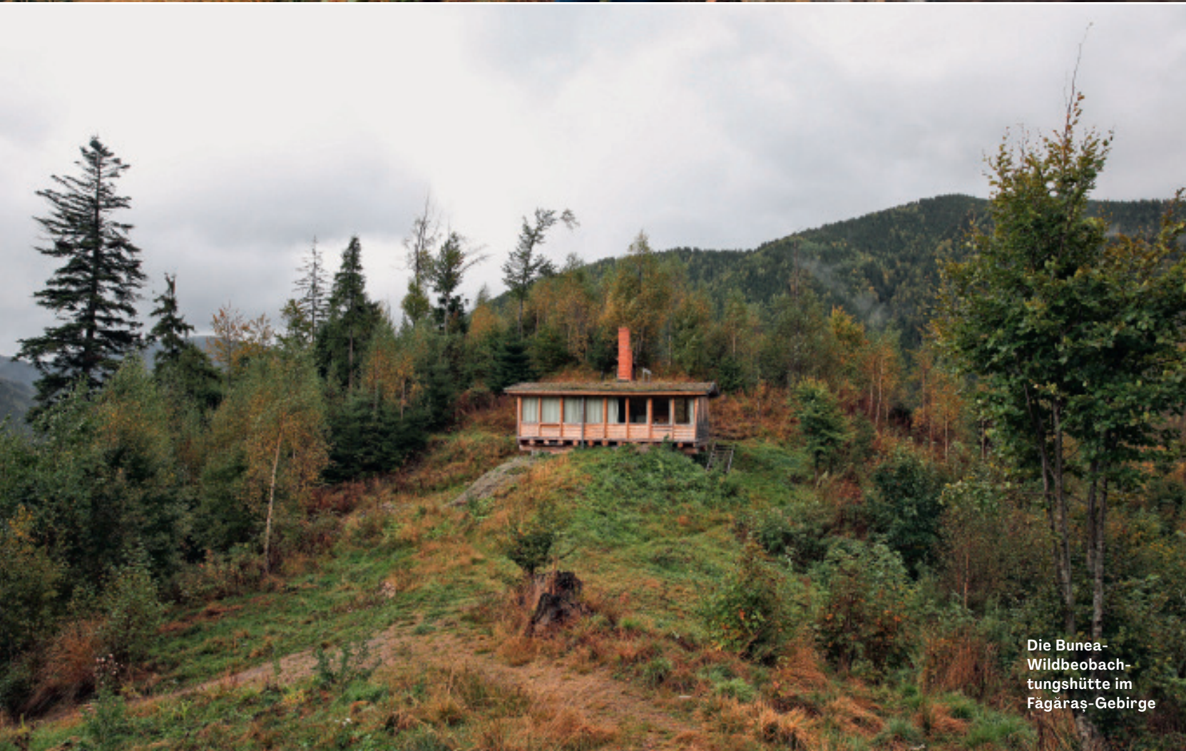
Die Bunea-Wildbeobachtungshütte im Făgăraș-Gebirge