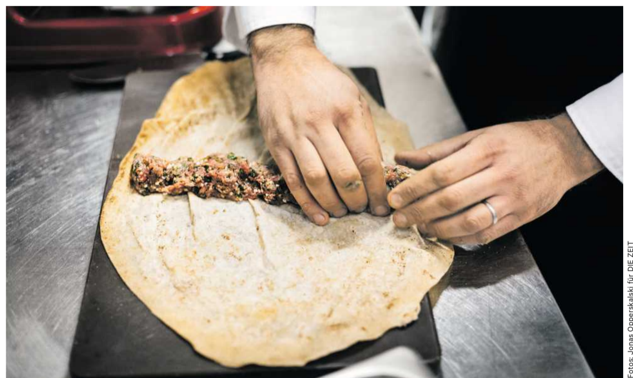
Seine Kreationen: Veredelte Lammrippchen und Fladenbrot mit Hackfleisch