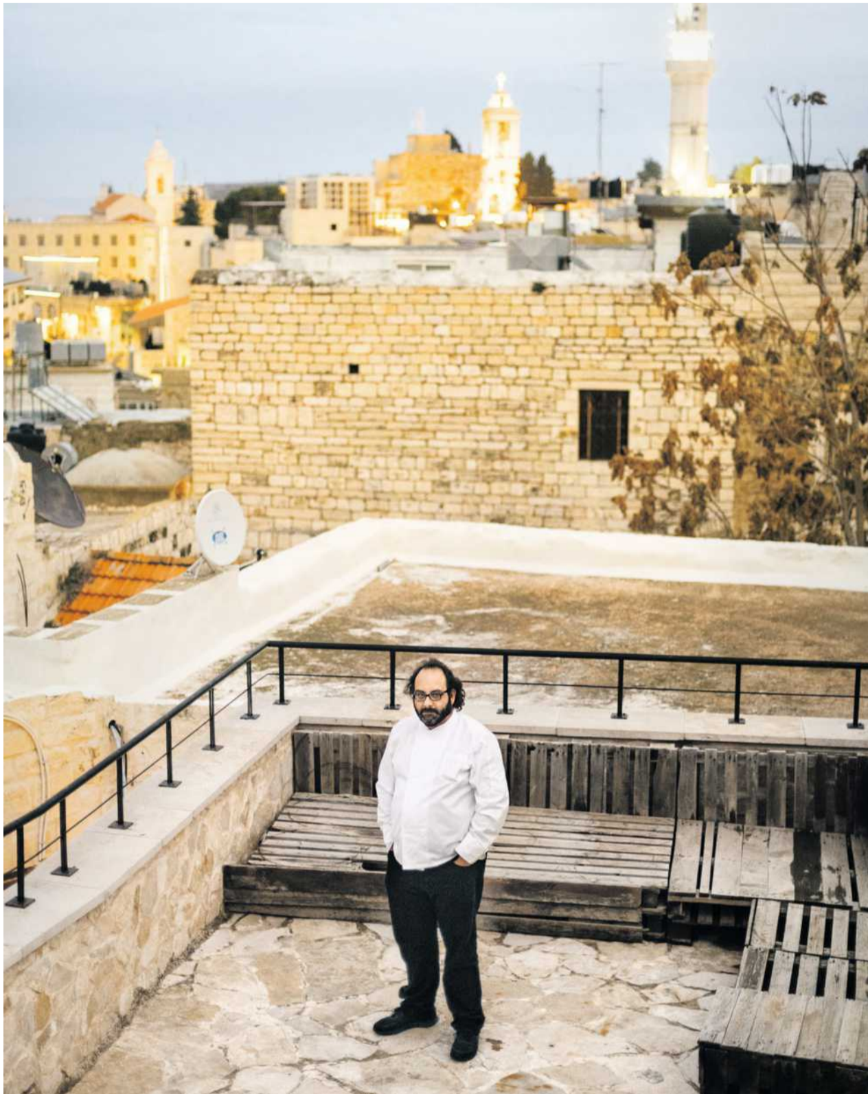
Der Koch auf der Terrasse seines Gästehauses – und beim Einkaufen