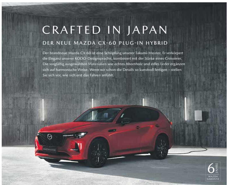
Mazda CX-60 Plug-in Hybrid – Verbrauchswerte kombiniert lt. WLTP: 1,5 l/100 km und 23 kWh Strom/100 km. CO 2 -Emissionen: 33 g/km. Werte sind Mittelwerte für Kraftstoff- und Stromverbrauch bei durchschnittlichem Nutzungsprofil und täglichem Laden der Batterie. Homologation nicht abgeschlossen.