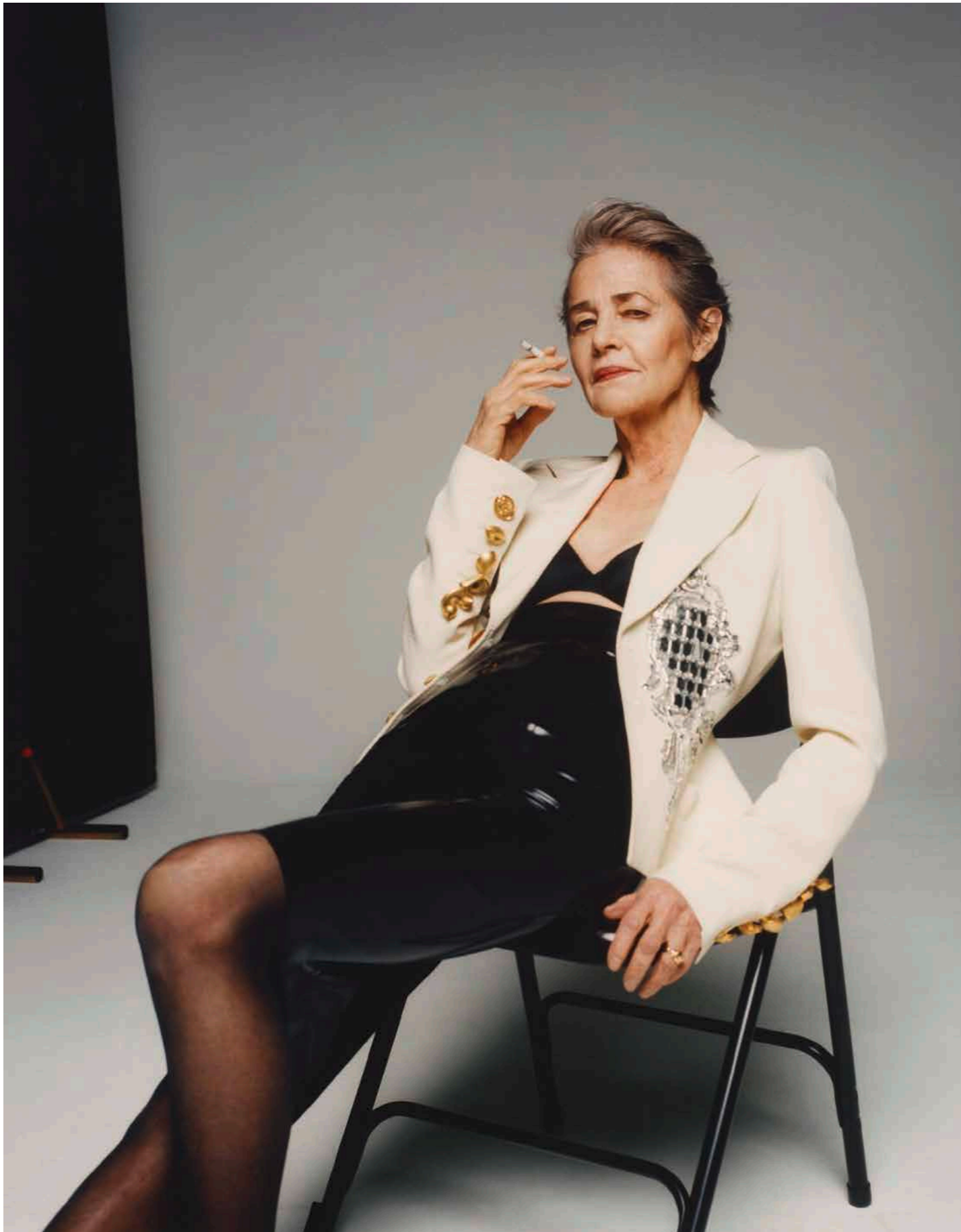
PROVOKANT Die Britin liebt es, mit ihren Rollen anzuecken. Und erntet regelmässig Lorbeeren dafür.

BOLERO Im Film «Juniper» geht es unter anderem um die Sehnsucht nach Heimat und Zugehörigkeit. Wonach sehnt man sich, wenn man schon so viel erreicht hat?