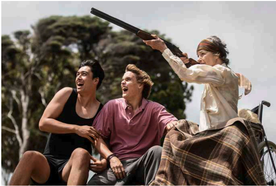
ÜBERZEUGEND In «Juniper» spielt Rampling die rastlose Rentnerin Ruth.

weniger immer in meinem Alter. Ich möchte niemanden verkörpern, der wesentlich älter oder jünger ist.