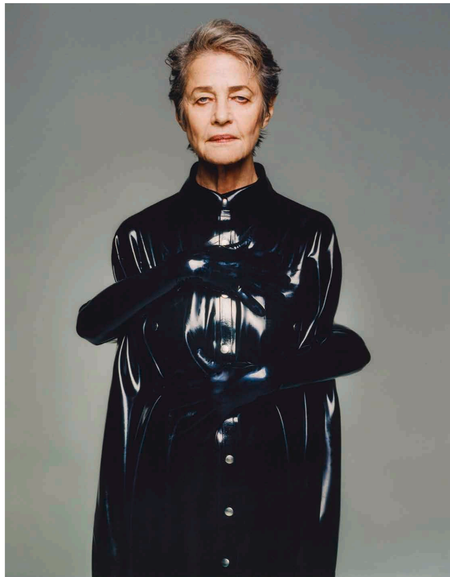
Styling: Jessica Steete-Cross Make-up: Anthony Pezal/Artist Paris Hair: Yujl Ouda/Artist Paris