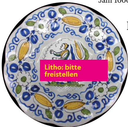
Litho: bitte freistellen