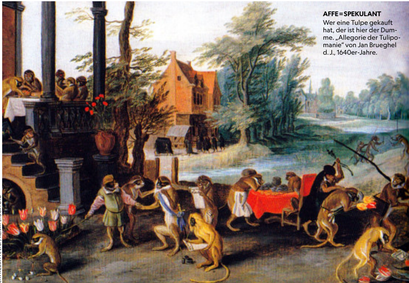
AFFE = SPEKULANT Wer eine Tulpe gekauft hat, der ist hier der Dumme. „Allegorie der Tulipomanie“ von Jan Brueghel d.J., 1640er-Jahre.