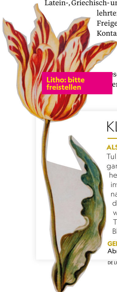
Litho: bitte freistellen