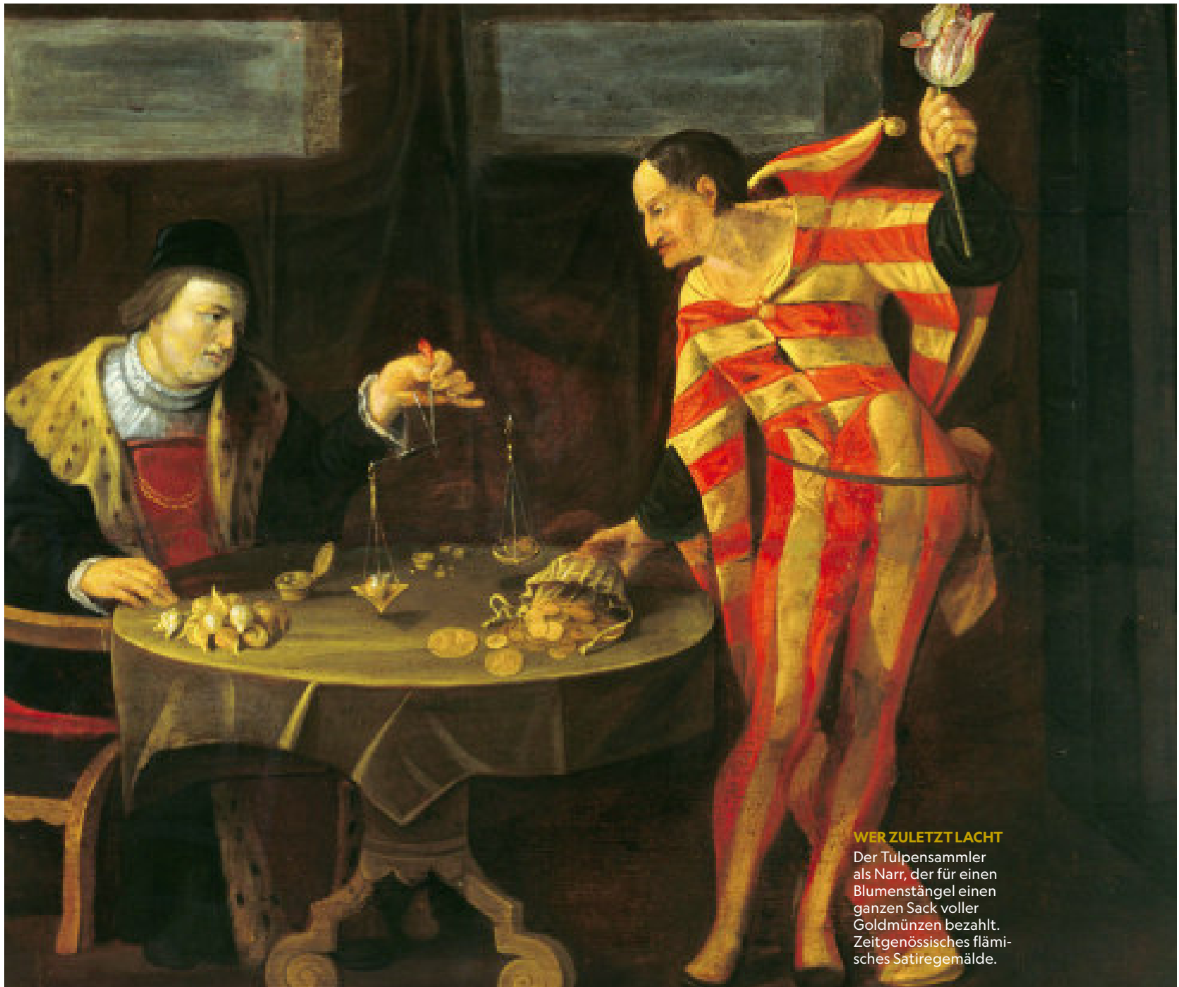
WER ZULETZT LACHT Der Tulpensammler als Narr, der für einen Blumenstängel einen ganzen Sack voller Goldmünzen bezahlt. Zeitgenössisches flämische Satiregemälde.

astronomische Höhen geschossen. Noch gut zwei Monate zuvor hatte das Pfund Switser weniger als 150 Gulden gekostet. Allein der Vertrag in seinen Händen ließe sich sicher schon bald mit gutem Gewinn weiterverkaufen.