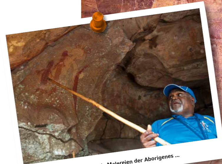
... faszinierende Malereien der Aborigines ...