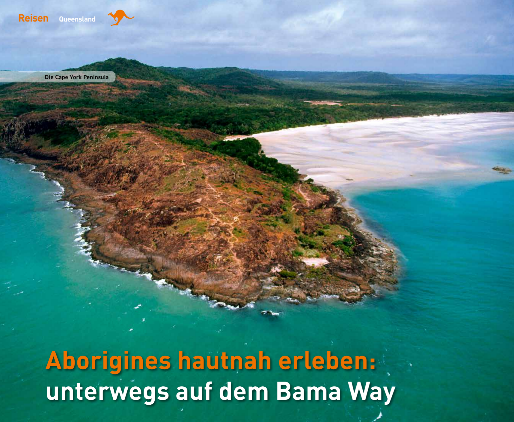
Die Cape York Peninsula