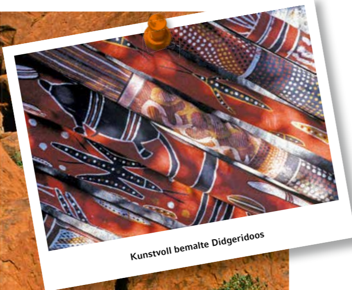
Kunstvoll bemalte Didgeridoos