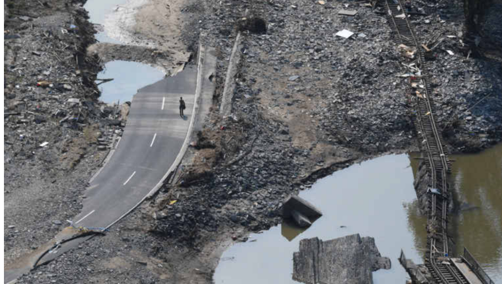
Ahrtal, Sommer 2021. Starkregenereignisse, die zu solchen Flutkatastrophen führen, werden mit fortschreitendem Klimawandel immer häufiger vorkommen

Emissionen verhindern und argumentierte, die Unsicherheiten bezüglich des Klimawandels seien einfach zu groß, um weitreichende Maßnahmen einzuleiten. 1989 berichtete die New York Times, der Mineralölkonzern Shell wolle eine gigantische Gasplattform im Ozean um ein bis zwei Meter erhöhen – aufgrund des zu erwartenden steigenden Meeresspiegels in den kommenden Jahrzehnten.