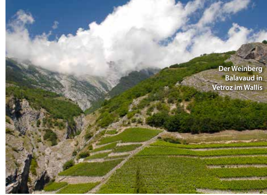
Der Weinberg Balavaud in Vetroz im Wallis