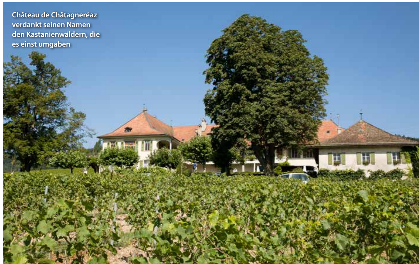
Château de Châtagneréaz verdankt seinen Namen den Kastanienwäldern, die es einst umgaben