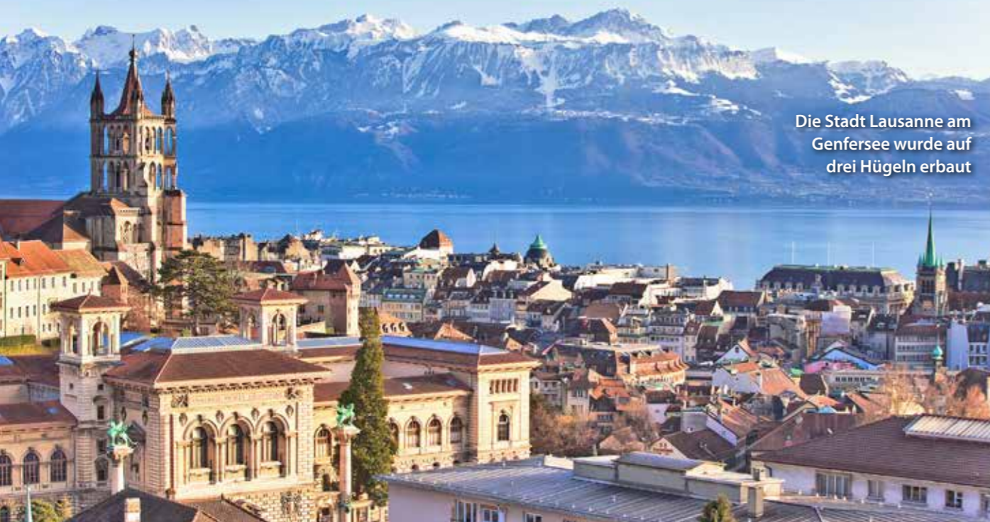
Die Stadt Lausanne am Genfersee wurde auf drei Hügeln erbaut