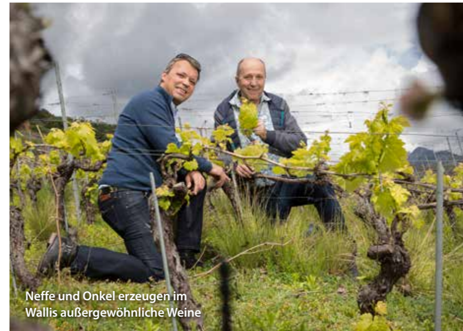
Neffe und Onkel erzeugen im Wallis außergewöhnliche Weine