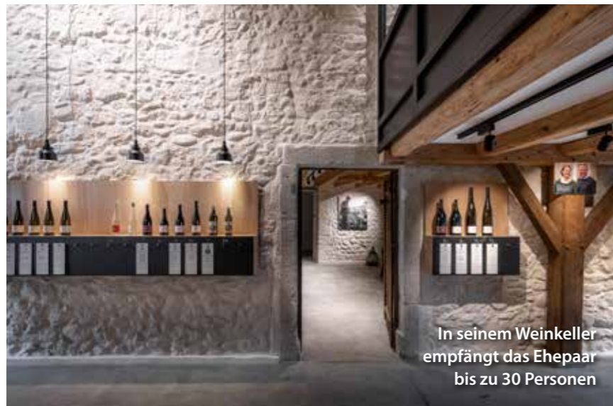
In seinem Weinkeller empfängt das Ehepaar bis zu 30 Personen