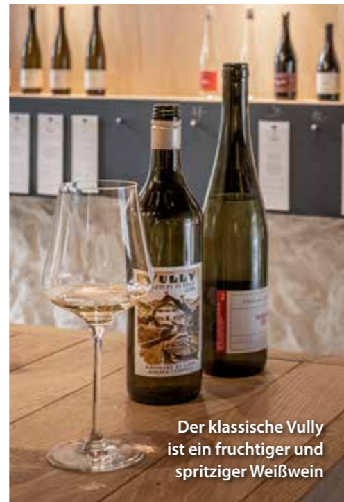
Der klassische Vully ist ein fruchtiger und spritziger Weißwein