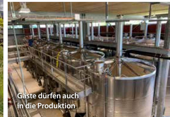
Gäste dürfen auch in die Produktion