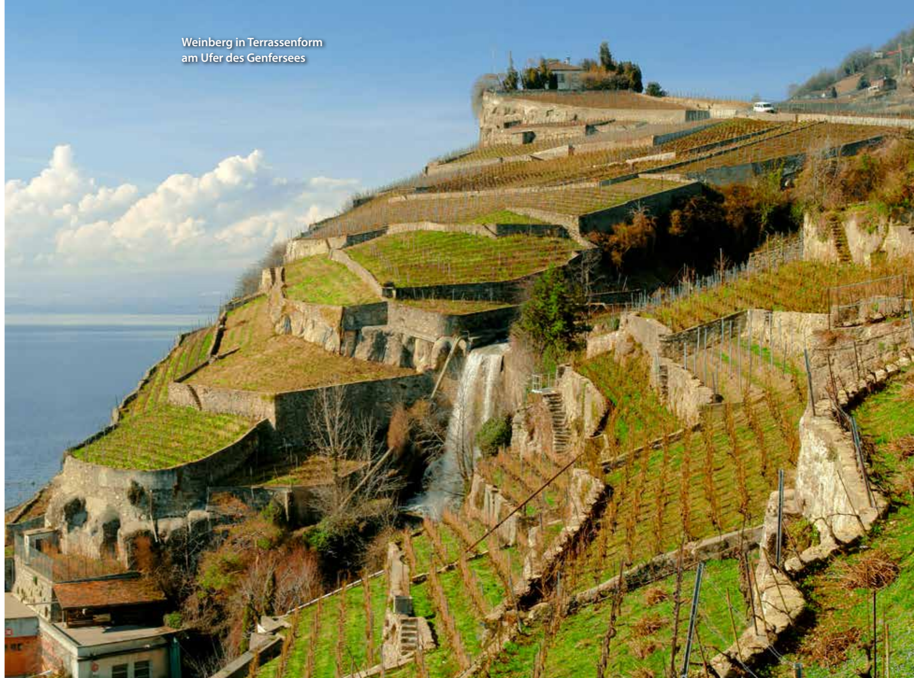
Weinberg in Terrassenform am Ufer des Genfersees