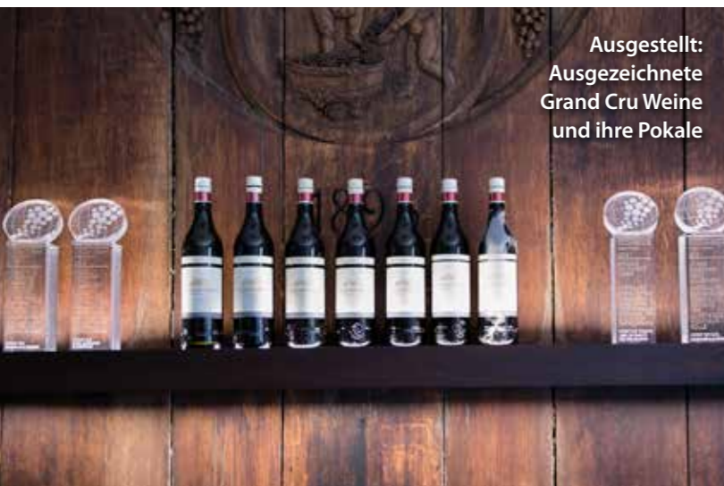
Ausgestellt: Ausgezeichnete Grand Cru Weine und ihre Pokale