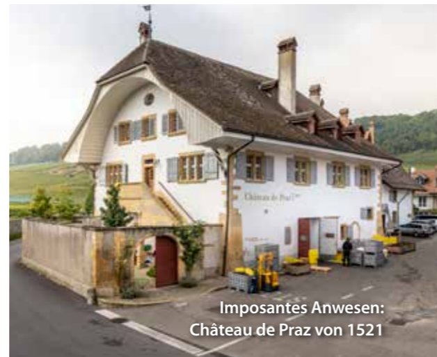
Imposantes Anwesen: Château de Praz von 1521