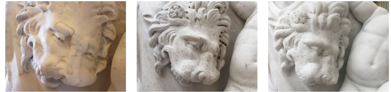
Dem historischen Original-Löwenkopf (links) fehlt es durch frühere Überarbeitungen an Oberfläche. Frank Schauseil hat die einstige Wirkung mithilfe von Fotos des Vorbilds im Vatikan wiedererweckt. Das Modell und die Marmorskulptur (Mitte und rechts) zeigen einen plastischeren, lebendigeren Löwen

plastischen Modell stimmen und soll gut und stimmig aussehen.“