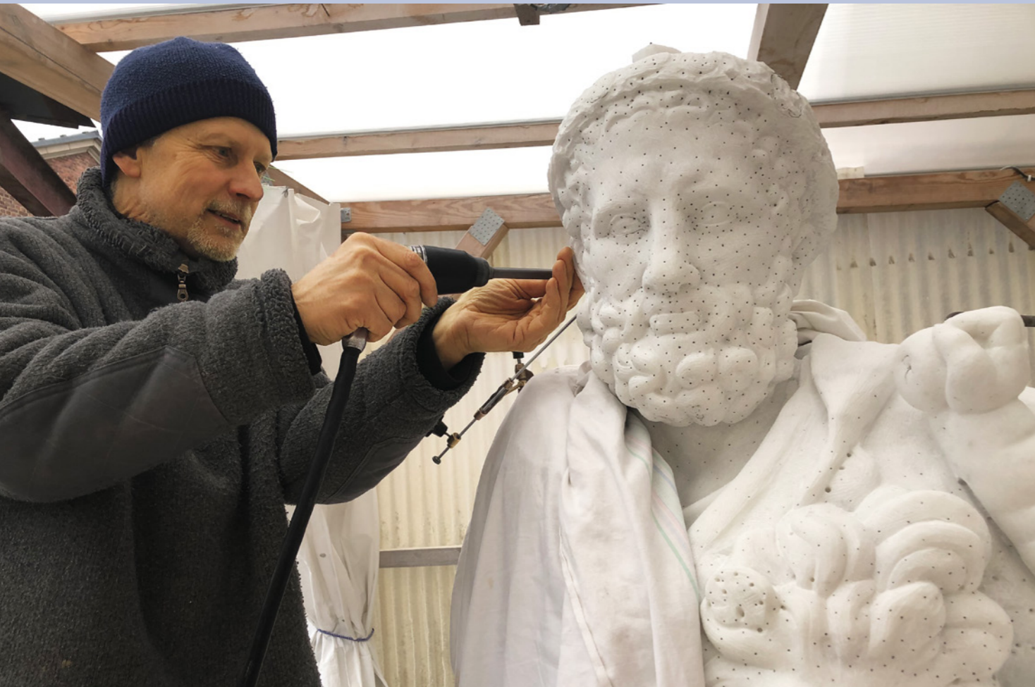
Inzwischen arbeitet der Bildhauer an der Kopie in Marmor – die Skulptur soll im Laufe des Jahres 2022 im Großen Garten aufgestellt werden, das historische Original steht im Palais des Großen Garten