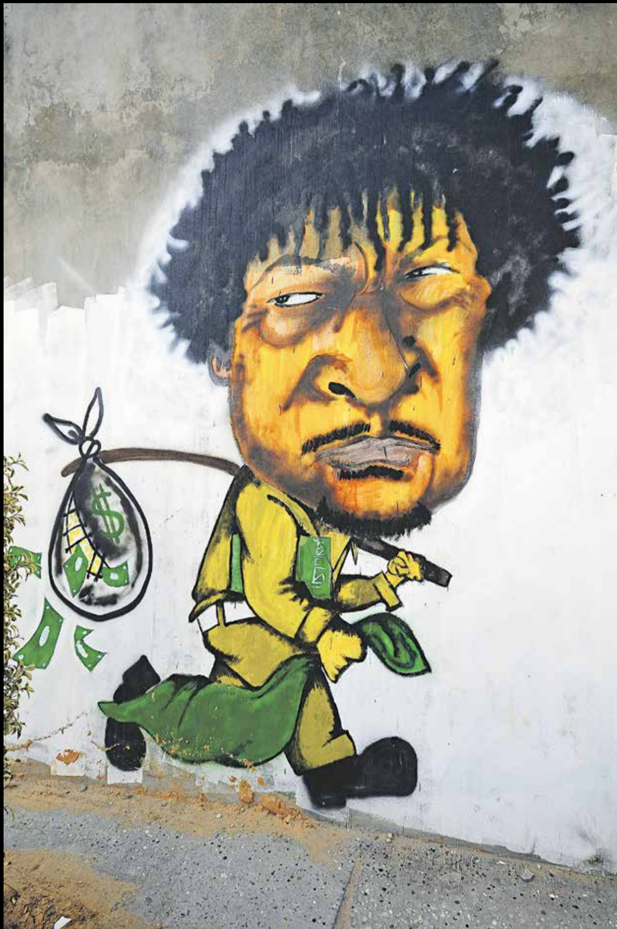
Wandbild in Tripolis, 2012

Bis zu seinem Tod bereicherte sich Muammar al-Gaddafi am libyschen Volk und versteckte ein riesiges Vermögen im Ausland. Zwei Männer aus Deutschland haben sich auf die Suche gemacht. Sie haben Verbindungen in rechtsextreme Kreise