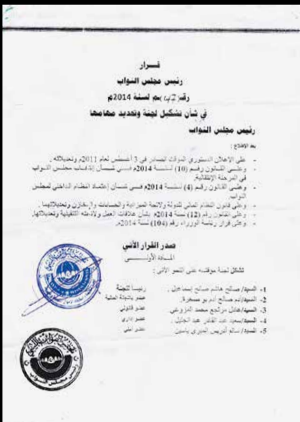
Das libysche Repräsentantenhaus beschloss 2014 die Bildung eines Ausschusses, um das versteckte Vermögen zu finden