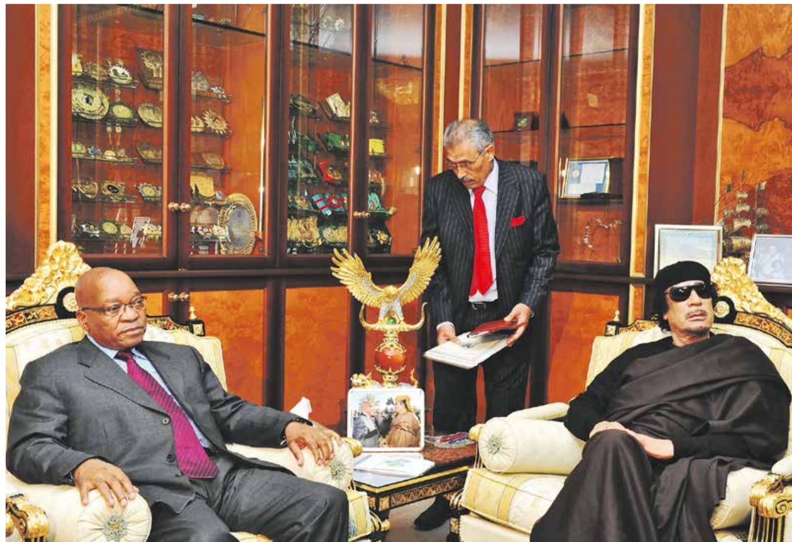
Südafrikas damaliger Präsident Jacob Zuma (li.) beim Staatsbesuch in Libyen 2011, mitten im Bürgerkrieg. Zuma half seinem Freund Gaddafi, Vermögen nach Südafrika zu schaffen.