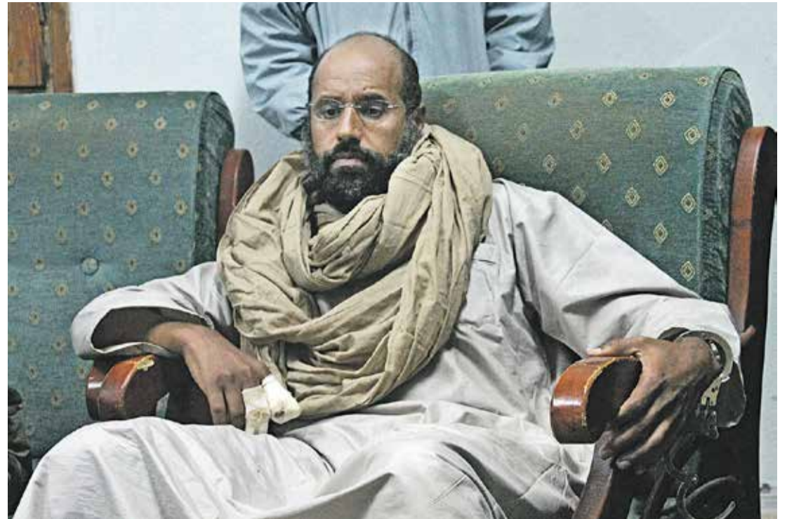
Gaddafis Sohn Saif al-Islam bei seiner Verhaftung 2013. Er will bei der Wahl antreten und seinem Vater nachfolgen. Was passiert, wenn er an den Schatz gelangt?

Die einzige Tochter Gaddafis, Aisha , 44, floh mit ihrer Mutter und den Brüdern Mohammed und Hannibal nach Algerien. Später erhielt sie Asyl im Oman.