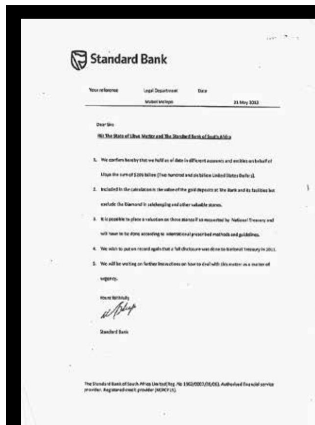
Die süd-afrikanische Standard Bank bestätigt, dass sie 200 Milliarden US-Dollar aus Libyen lagert – und Gold und Diamanten