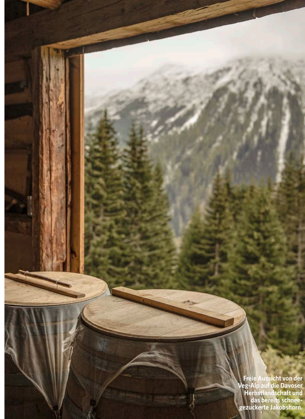
Freie Aussicht von der Veg-Alp auf die Davoser Herbstlandschaft und das bereits schneegezuckerte Jakobshorn.