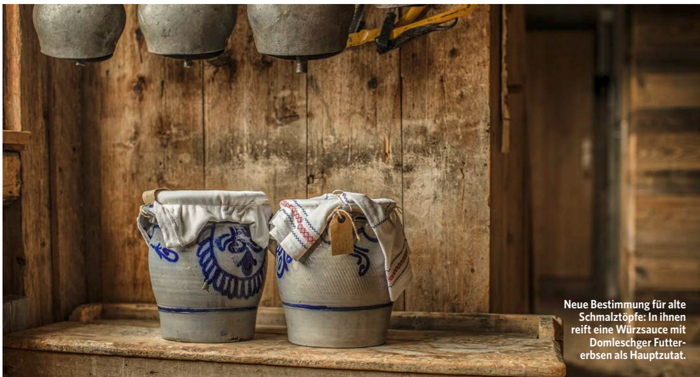
Neue Bestimmung für alte Schmalztöpfe: In ihnen reift eine Würzsauce mit Domlescher Futtererbsen als Hauptzutat.