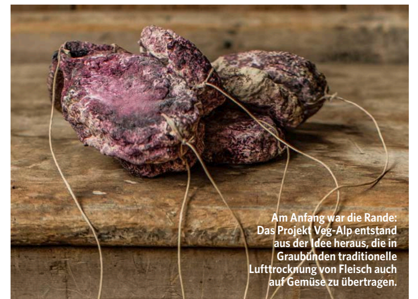
Am Anfang war die Rande: Das Projekt Veg-Alp entstand aus der Idee heraus, die in Graubünden traditionelle Lufttrocknung von Fleisch auch auf Gemüse zu übertragen.