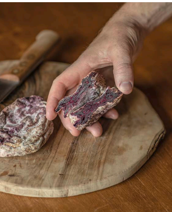
Tatsächlich kein Fleisch: Veg-Alps Bio-Rande im Edelschimmelpelz.