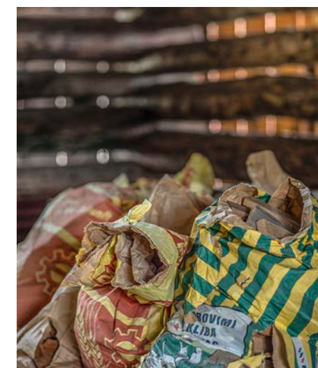
Alte Futtersäcke als kleine Farbtupfer in der holzig braunen Maiensässwelt.