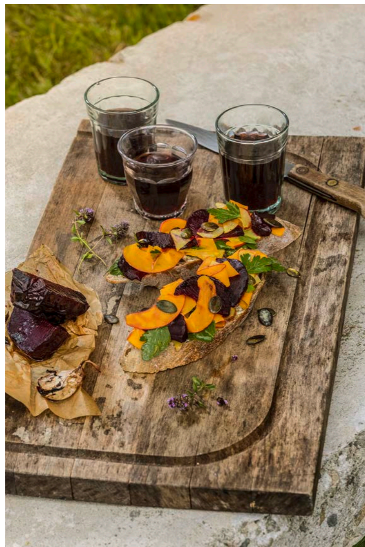
Bündner Plättli ohne Trockenfleisch, dafür mit Ofenrande.