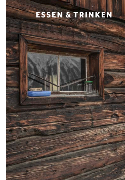
Auch die Fensterbänke sind hier willkommene Ablageflächen.