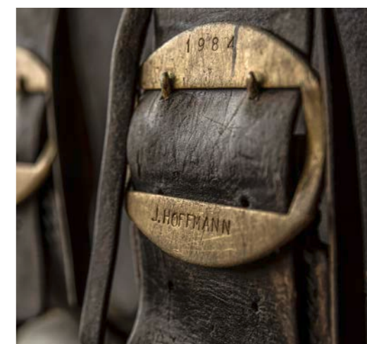
Aus der Zeit, als auf der Alp noch Kühe sömmeren.