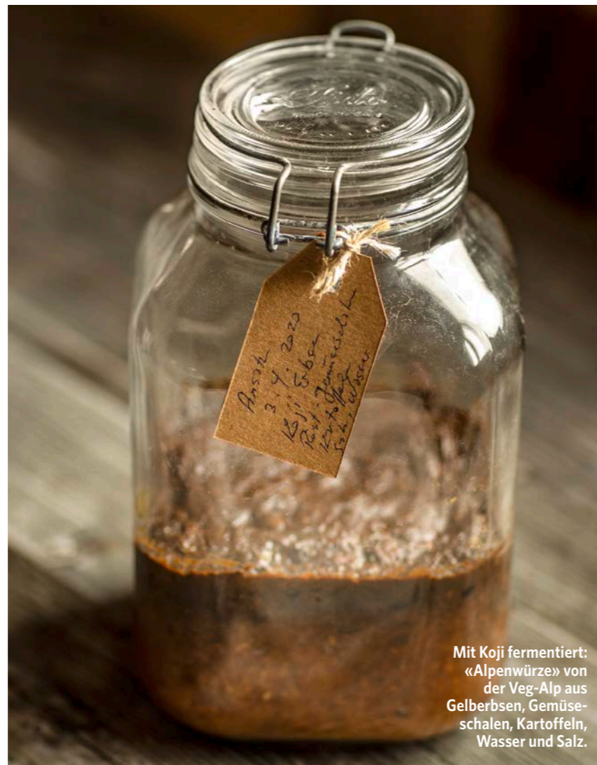
Mit Koji fermentiert: «Alpenwürze» von der Veg-Alp aus Gelberbsen, Gemüschalen, Kartoffeln, Wasser und Salz.

Der japanische Begriff «koji» bezeichnet Reis, das mit dem Schimmelpilz Aspergillus oryzae geimpft wurde; auch Gerste wird dafür gerne verwendet. Der Pilz liebt das feuchte, warme Klima auf gekochtem Getreide. Es sind die idealen Bedingungen dafür, dass sich seine Sporen auf diesem Substrat rasch vermehren und fadenförmige Zellen («Hyphen») ausbilden können. Diese Zellen wachsen in die Körner ein und setzen dabei bestimmte Enzyme frei, die für den süsslichen, fruchtigen Umami-