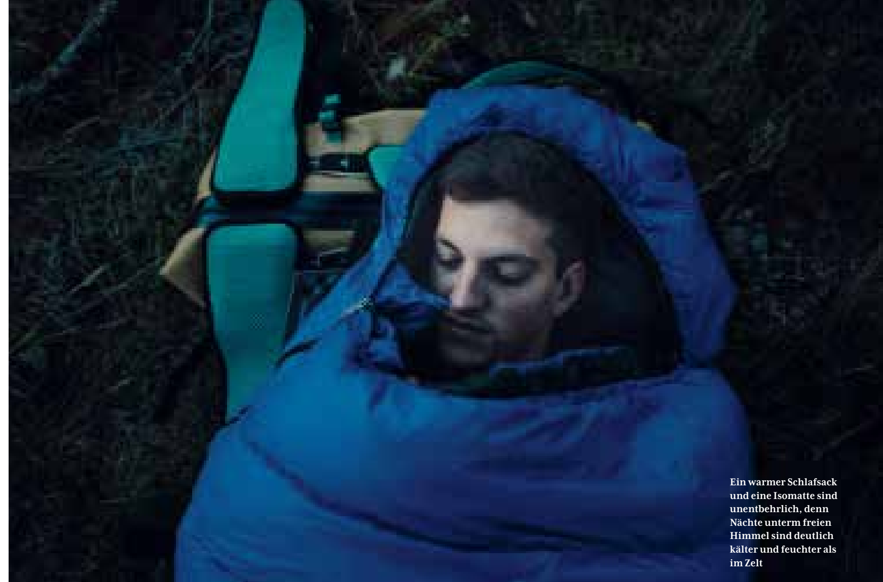
Ein warmer Schlafsack und eine Isomatte sind unentbehrlich, denn Nächte unterm freien Himmel sind deutlich kälter und feuchter als im Zelt

Achtzig Kilometer und fünf Tage später erreiche ich den Dreifürstenstein, einen 860 Meter hohen Felsvorsprung an der Nordwestseite der Schwäbischen Alb. Im Osten geht gerade die Sonne auf, rot-gelb-orange, am Horizont tanzen die Farben. Ich stehe auf dem Bergvorsprung am Waldrand, der Boden ist weich, unter meinen schweren Stiefeln raschelt das Laub vom Vorjahr. Ich blicke nach Süden, zu den Tälern und Hügeln, über die ich in den vergangenen Tagen gewandert bin. Irgendwo dort hinten liegt mein Dorf, da will ich wieder hin und dann weiterwandern. Nach Westen, Osten oder Süden. Es gibt noch viel zu entdecken, auf der anderen Seite des Gartenzauns. Ich genieße ein letztes Mal die Aussicht, atme tief ein, aus, und während die tanzenden Farben am Horizont allmählich dem Licht des Tages weichen, wandere ich weiter durch meine neue, alte Heimat. <