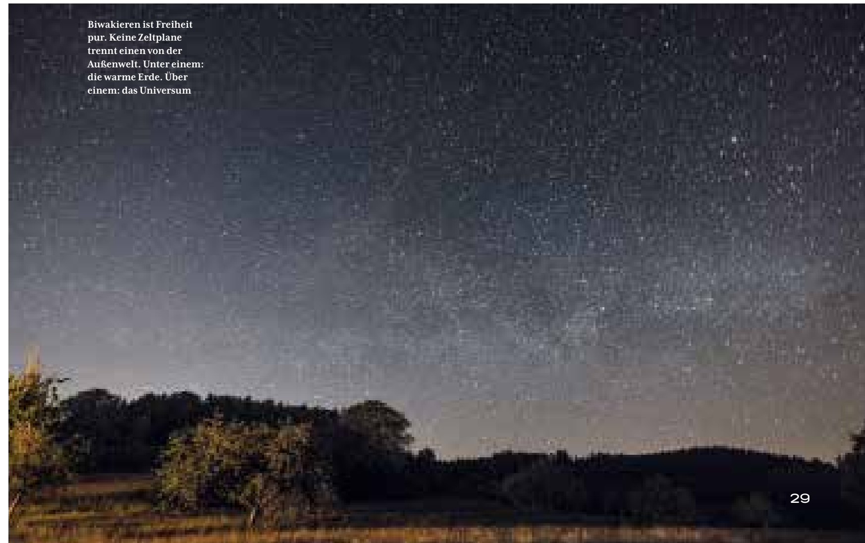
Biwakieren ist Freiheit pur. Keine Zeltplane trennt einen von der Außenwelt. Unter einem: die warme Erde. Über einem: das Universum