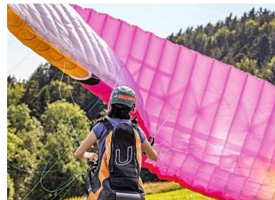
Der rosafarbene Gleitschirm für Anfänger hat ein „extrem verzeihendes“ Flugverhalten. Aber fliegen tut er trotzdem

In meinem Fall reicht es, nicht blindlings in das Abenteuer hineinzulaufen. Mir Zeit zu nehmen, ruhig zu atmen. Ich warte, bis ich innerlich „Ja“ sagen kann. Dann kommt der erste