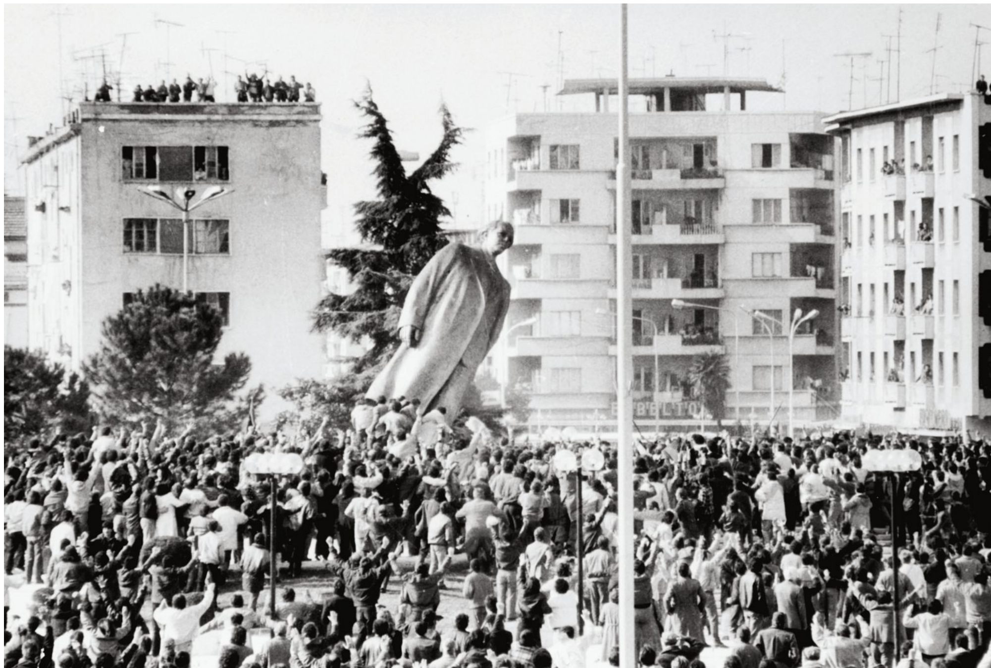
So stürzt man Diktatoren: Enver Hoxhas Statue in Tirana wird 1991 zu Fall gebracht.