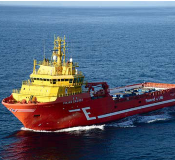
Links: Die Viking Energy der Reederei Eidesvik ist das weltweit erste Schiff, das mit einer Brennstoffzelle auf Ammoniak-Basis ausgerüstet wird.