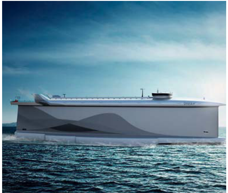
Rechts: Ein futuristisches Konzept hat die Vindskip AS. Der überproportional hohe Rumpf soll als Segel-Ersatz für den Vortrieb in Fahrt sorgen. Transportiert werden sollen bis zu 6.600 Automobile. Noch sucht die „Vindskip AS“ nach Investoren.

effizientere Raum- und Gewichtskonzepte lassen sich Kosten und Verbräuche senken. „Mit der Entwicklung unserer TRU können wir an Bord deutlich Platz einsparen.“ Durch Entgasung des rücklaufenden Hydrauliköls lässt sich die Beruhigungszone drastisch reduzieren: So berichtet von der Osten von industriellen Anwendungen, in denen die Ölmenge von 4.000 auf 400 Liter reduziert werden konnte.