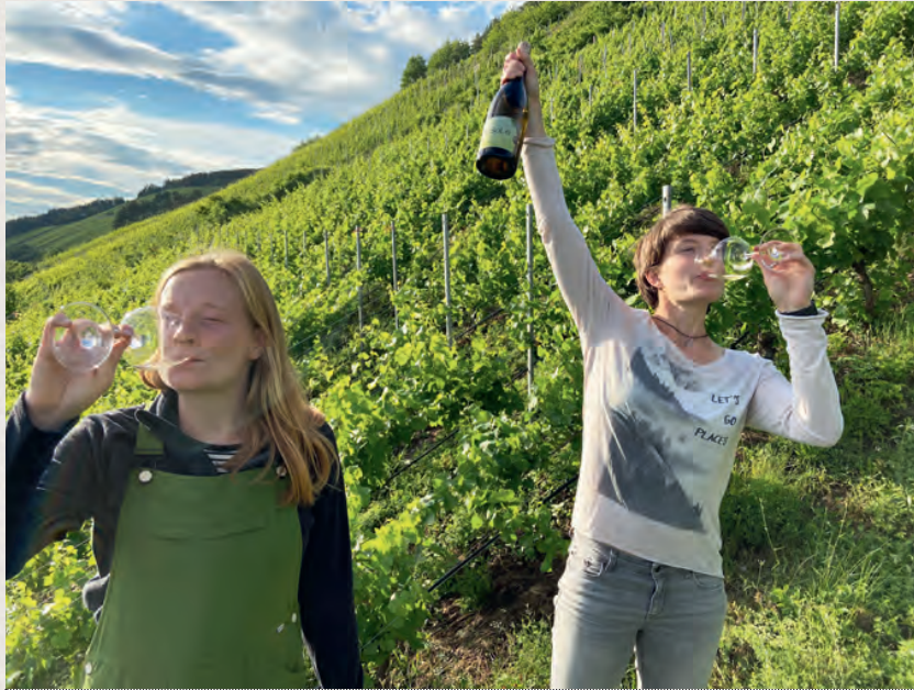
Bei der Spontanvergärung ließ der Most sich etwas bitten