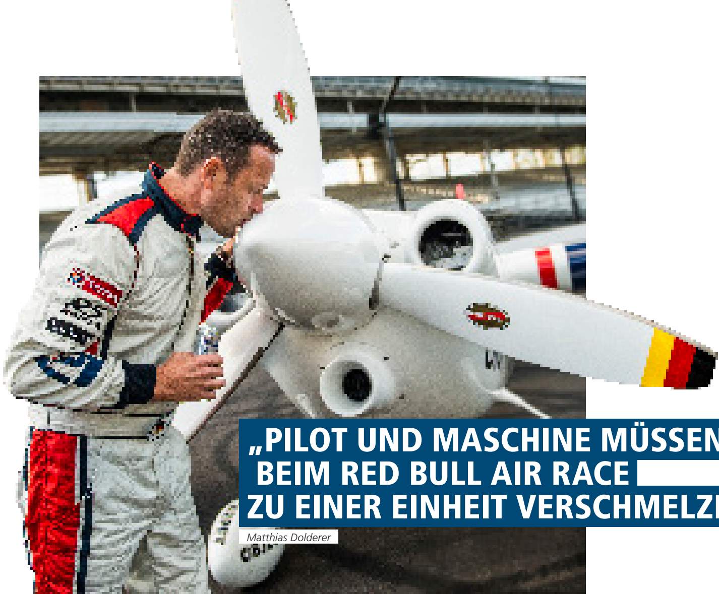
Wenn Matthias Dolderer im Cockpit seiner Zivko Edge 540 V3 die Luftkurve kratzt, verzehnfachen die Fliehkräfte sein Körpergewicht