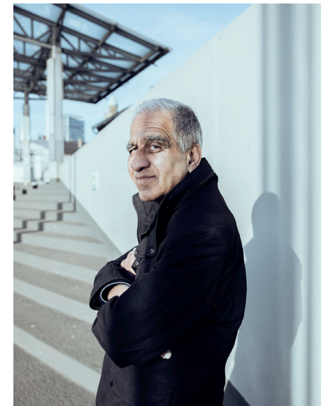
Seit Jahrzehnten warnt Mojib Latif vor dem Klimawandel. Hat ihm denn niemand zugehört?

~ Ein ganzes Menschenglück ist auf diese sorglose Unwissenheit gebaut! ~