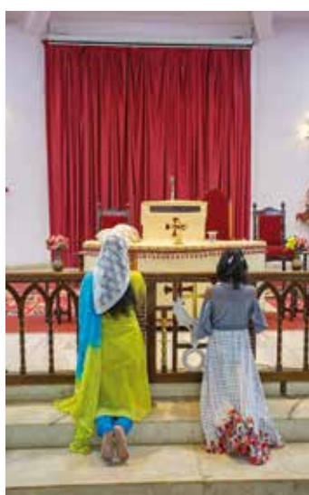
Gebet: Betende Frauen in der Hebich Memorial Church in Dharwad nach dem Gottesdienst