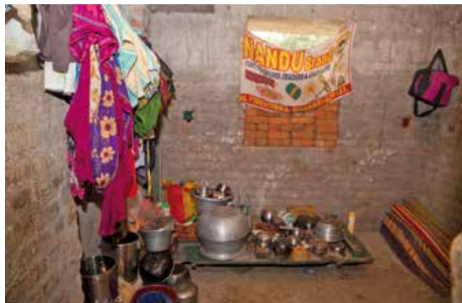
Notdürftig: Ein Blick in die Küche von Ramyams Familie