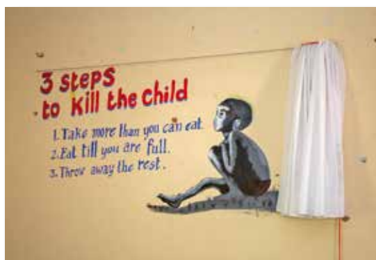
Mahnung: Wandmalerei in der Mensa der theologischen Hochschule in Hyderabad