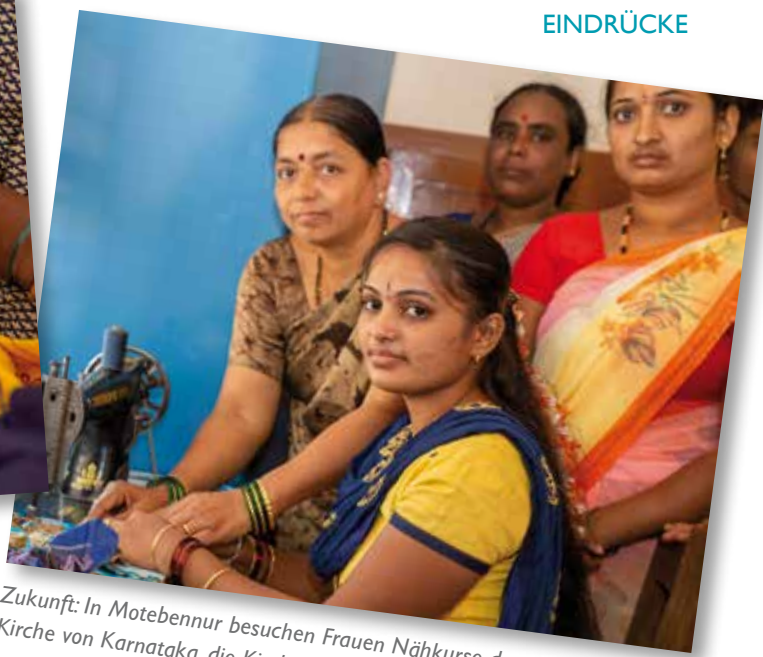
Zukunft: In Motebennur besuchen Frauen Nähkurse der protestantischen Kirche von Karnataka, die Kinder sind oft mit dabei (links).