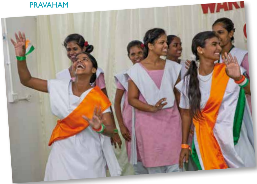
Lebensfreude: Die Schülerinnen in Pravaham zeigen einen Tanz, gekleidet in die indischen Landesfarben (oben)