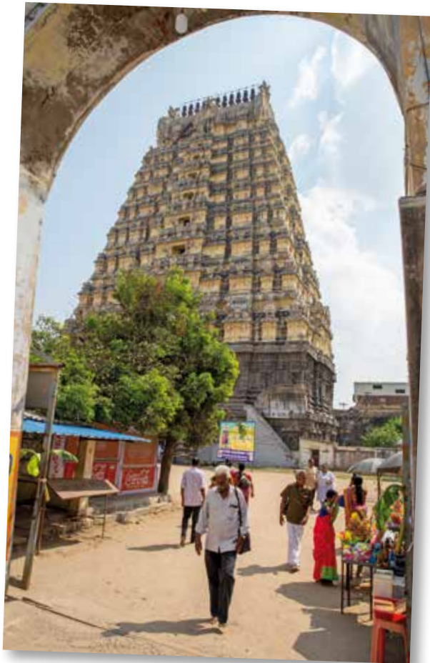
Heiligtümer: Einer von 200 Tempeln in der Stadt Kanchipuram, einem der sieben heiligen Orte im Hinduismus.