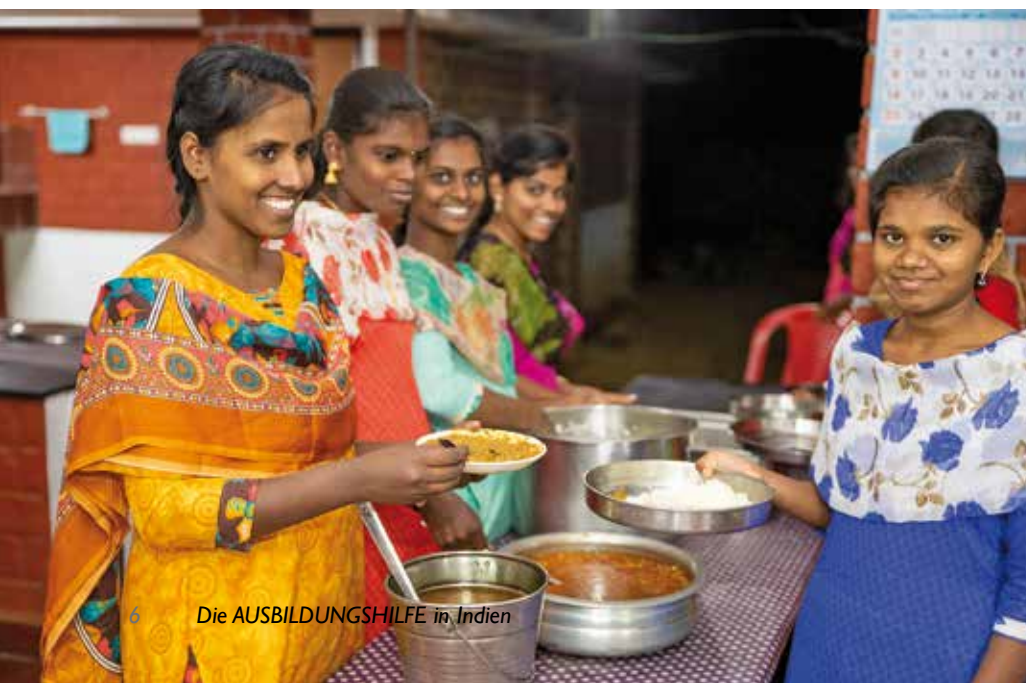
6 Die AUSBILDUNGSHILFE in Indien

Doch das sind Ausnahmen: In der Regel sind Dalits von Armut betroffen, viele begeben sich in Schuldknechtschaft – müssen also hohe Schulden über Jahre in Reismühlen oder Backsteinfabriken arbeiten. Das Durchschnittseinkommen betrage etwa 150 Rupien am Tag (umgerechnet nicht mal zwei Euro). Traditionell waren Dalits für die Aufgaben zuständig,