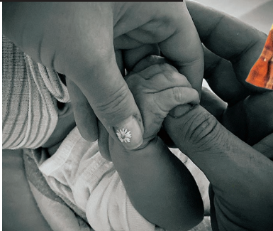
Unten: Das erste Foto von Orlando Bloom und Katy Perry mit Baby Daisy Dove