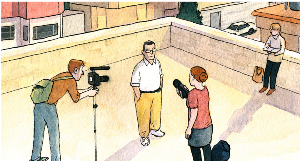
Ein Hausdach im Irak: Interviewszene aus „Im Schatten des Krieges“ von Sarah Glidden