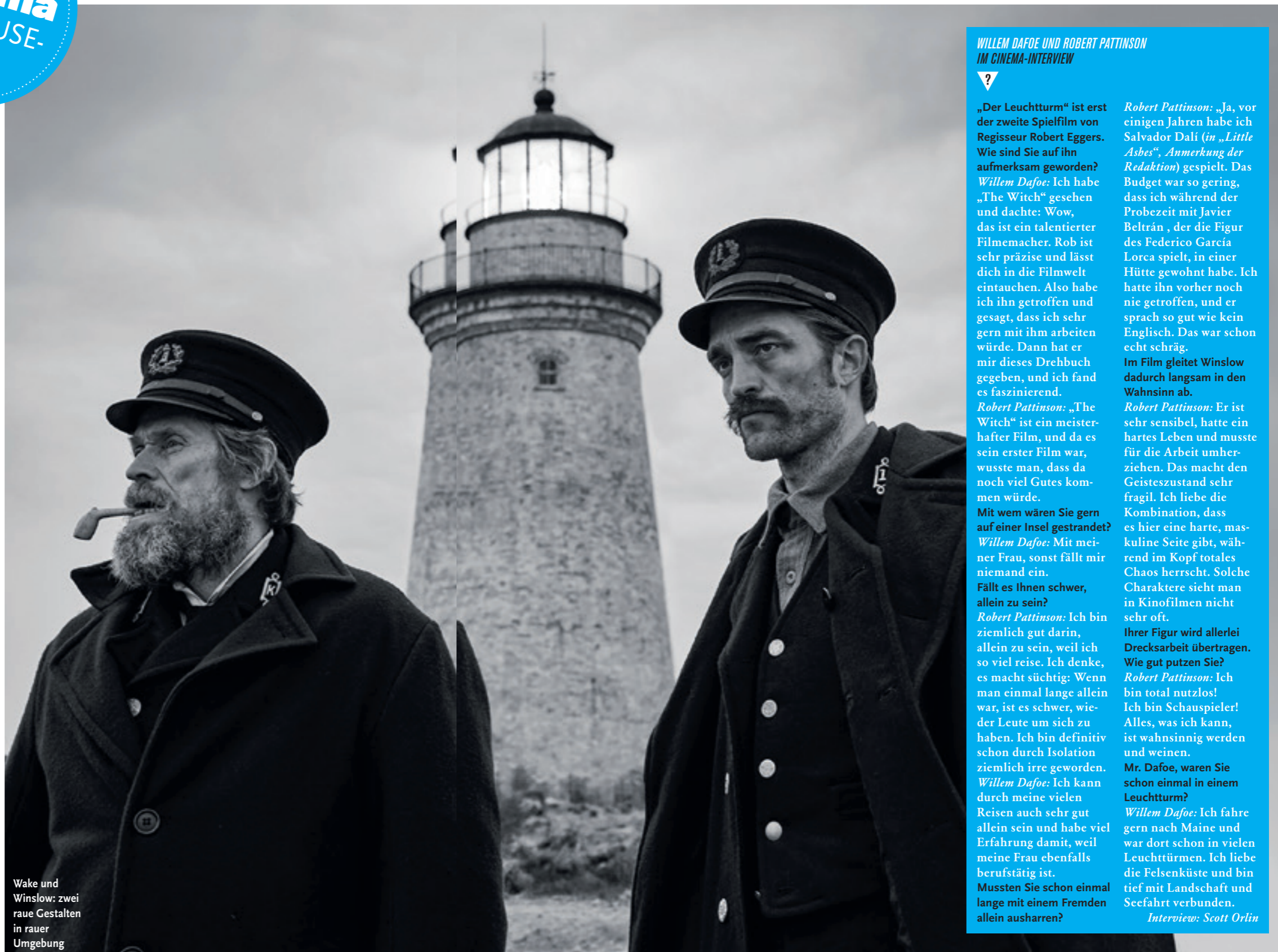
Wake und Winslow: zwei raue Gestalten in rauer Umgebung