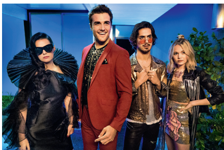
Verliebt in andere und sich selbst: Severine (Roxane Mesquida), Ford (Beau Mirchoff), Ulysses (Avan Jogia), Carly (Kelli Berglund, v. l.)

Der etwas einfältige Drehbuchautor Ford (Beau Mirchoff) liebt seine Freundin Severine (Roxane Mesquida) sehr, die pragmatische Astrobiologin mag es hingegen unverbindlicher. Ulysses (Avan Jogia) weiß nicht wirklich, was er will, hat aber zumindest nichts gegen spontanen Sex mit anderen Männern, hin und wieder versucht er sich bei einer E-Zigarette vor dem Tablet als