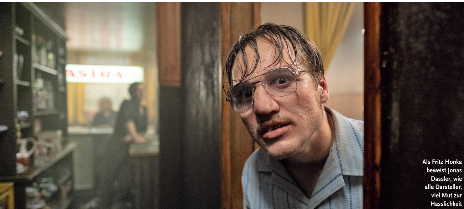
Als Fritz Honka beweist Jonas Dassler, wie alle Darsteller, viel Mut zur Hässlichkeit

BEREITS IM KINO Extreme Bilder: Mit seiner Inszenierung von Heinz Strunks gleichnamigem Tatsachenroman über den Serienmörder Fritz Honka treibt Regisseur Fatih Akin („Gegen die Wand“) den Zuschauer an die Grenzen des Zumutbaren. Wie gut, dass man diesen Film nicht riechen kann!