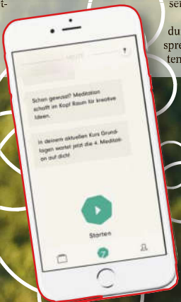
Entspannungsübungen mit dem Smartphone...