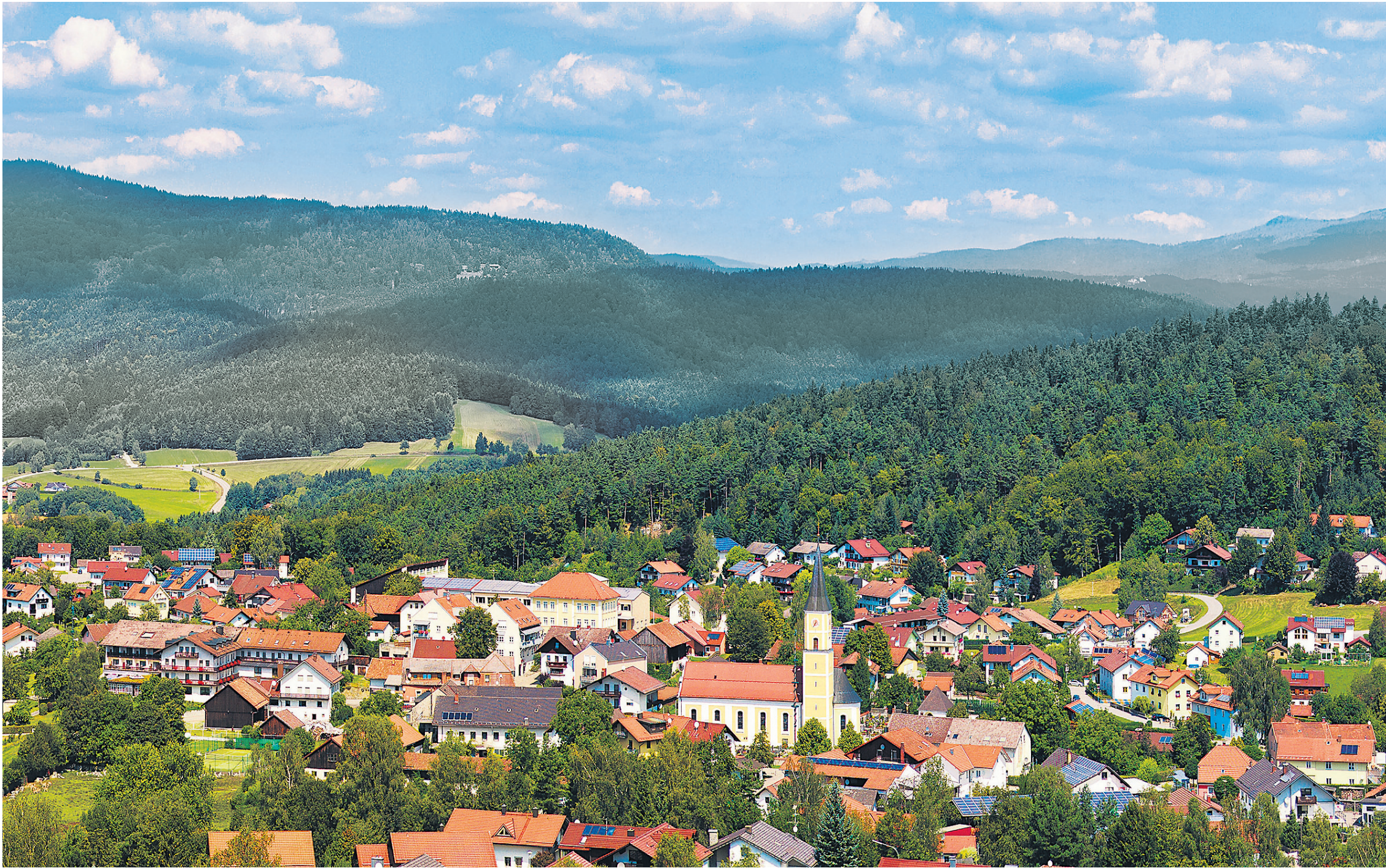
Strahlende Zukunft. Thurmansbang steht auf der Liste geeigneter Orte für ein Atommüllendlager. Doch die Bürger beginnen bereits sich zu vernetzen – und leisten Widerstand.