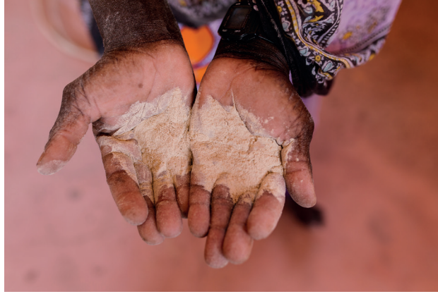
In der Produktionshütte riecht es nach Nelke, Limette und Eukalyptus. Hier fertigen die Frauen aus den getrockneten Algen Seifen und Lotionen.