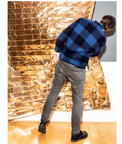
Wo versteckt sich die Wahrheit? Forensische Architekten rekonstruieren ein vermeintliches Verbrechen.