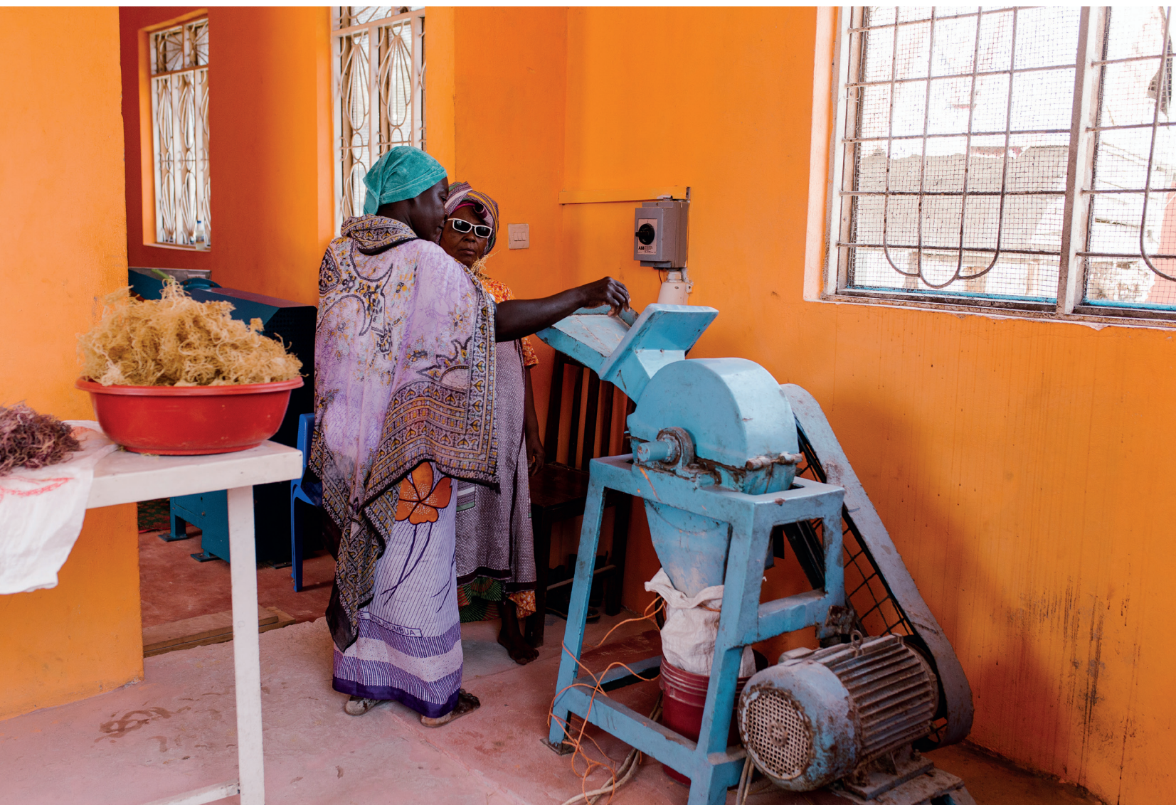
Durch das Mahlen der Algen zu Pulver steigert sich ihr Wert um das bis zu Zwanzigfache. Ein Kilo Algenpulver kostet rund sechs Euro.

Über die Jahre waren die Fluten immer näher an das Dorf heran gekommen. Das Wasser war wärmer geworden, die Wellen stärker. Und als Folge der Überdüngung des Ozeans durch ungeklärte Abwässer aus der Landwirtschaft war die Oberfläche manchmal so übersät von der giftigen Grünen Spanalge, dass die Frauen mit rotem Ausschlag und geschwollenen Augen von den Feldern kamen.