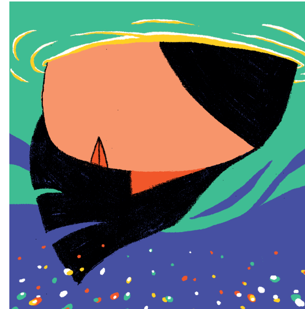
Warum zieht es Menschen ans Meer? Eine Suche.