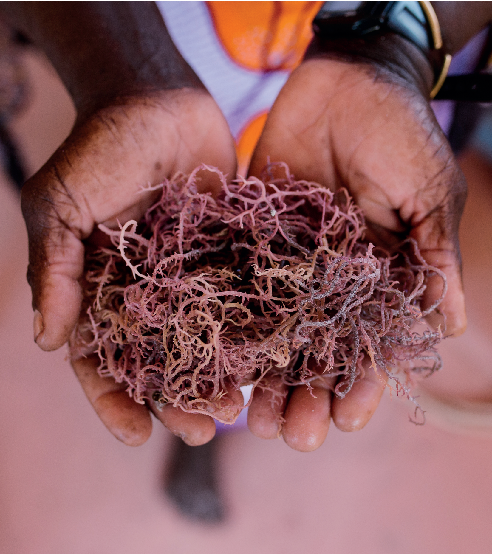
Die Alge ist für die Frauen von Sansibar ein Schatz.