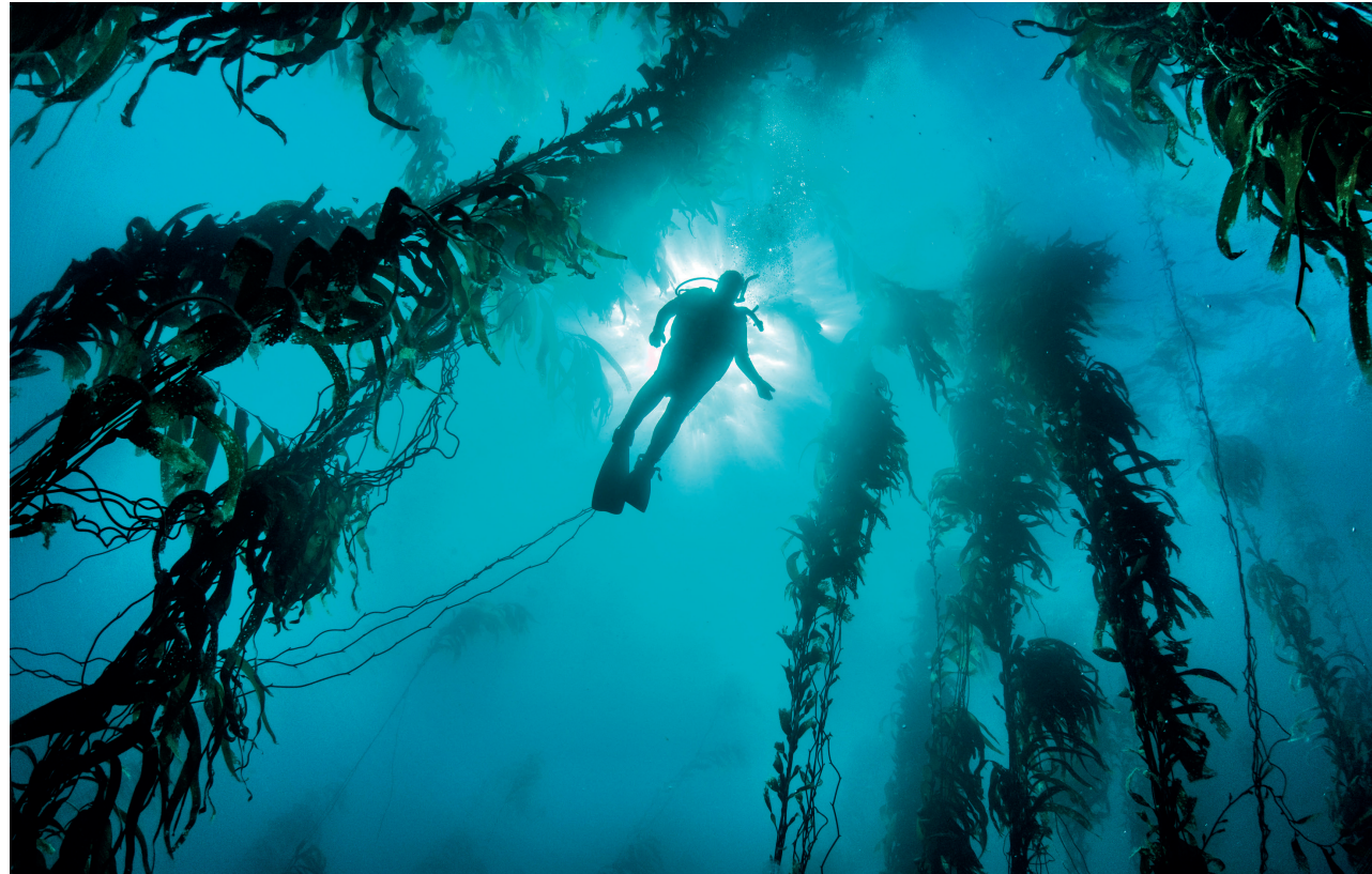
Der Fotograf und Meeresbiologe Uli Kunz erforscht eine Welt, die kaum jemand vor ihm gesehen hat.