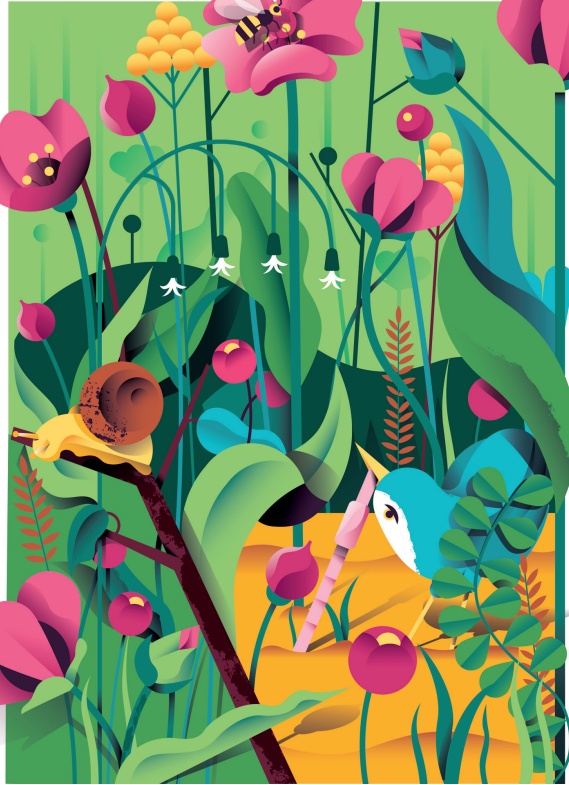
Blühstreifen mitten im Acker wirken wie Oasen für Insekten

Doch von Beginn an stand fest: Die Wirtschaftlichkeit der Höfe muss gesichert bleiben, die Landwirte wurden zu nichts gezwungen. Es galt, zusammen herauszufinden, welche Naturschutzmaßnahmen sich für welche Betriebe eignen. Fünf bis zehn Prozent ihrer Agrarfläche sollten die