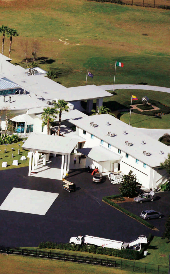
Haus mit Flügeln: Hier können Robert Downey Jr., 55, und Ehefrau Susan, 46, entspannen