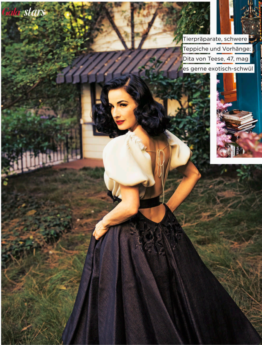
Tierpräparate, schwere Teppiche und Vorhänge: Dita von Teese, 47, mag es gerne exotisch-schwül