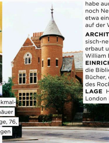
Ob es in dem denkmalgeschützten Gemäuer spukt? Jimmy Page, 76, hätte nichts dagegen