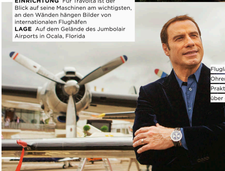
Fluglärm? Ist Musik in den Ohren von John Travolta, 66. Praktisch: Sein Haus verfügt über eine eigene Landebahn