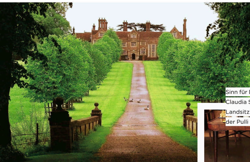
Sinn für Design: Auf Claudia Schiffers, 49, Landsitz passt sogar der Pulli zum Teppich