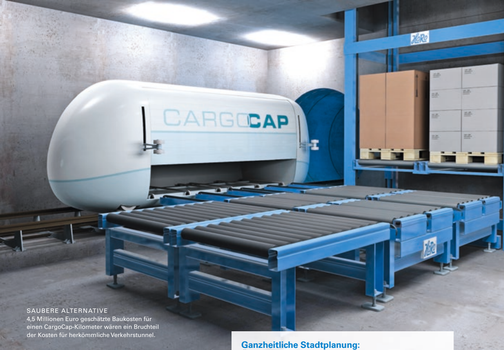
SAUBERE ALTERNATIVE 4,5 Millionen Euro geschätzte Baukosten für einen CargoCap-Kilometer wären ein Bruchteil der Kosten für herkömmliche Verkehrstunnel.