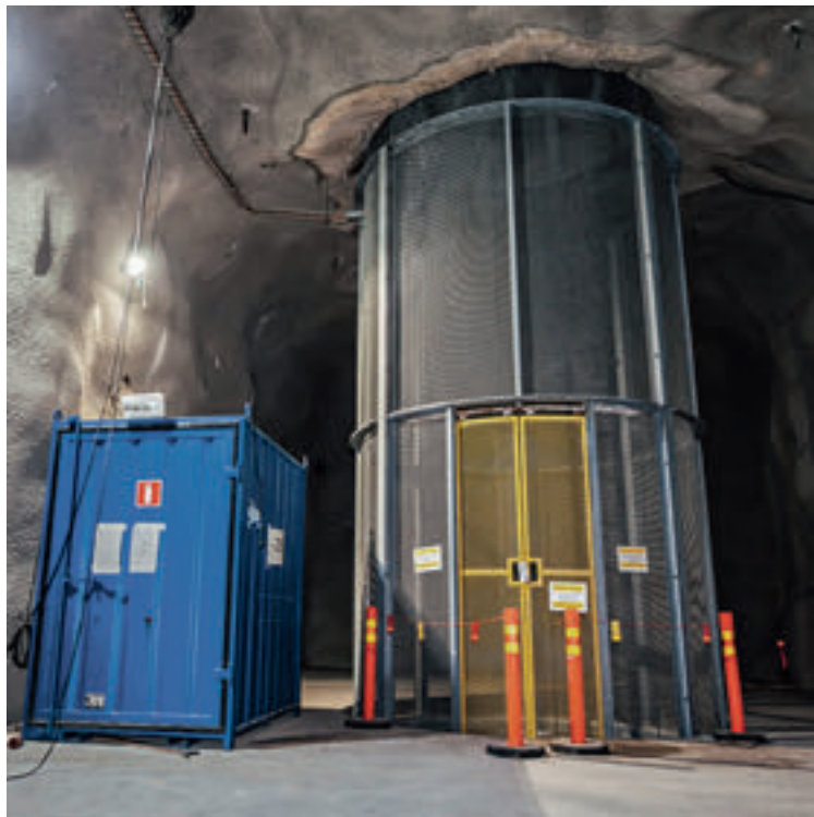
FLUCHTWEG: Ein Lastenaufzug im Abluftschacht kann im Notfall genutzt werden, um Mitarbeiter aus 290 Metern Tiefe in Sicherheit zu bringen

Doch selbst die Skandinavier können den Atommüll nicht unbegrenzt in oberirdischen Abklingbecken und wartungsintensiven Zwischenlagern sammeln, nachdem er dort schon mehr als 40 Jahre lagert. Onkalo ist somit jene dauerhafte Entsorgungslösung, über die Industrienationen wie Deutschland – rund 60 Jahre nach Beginn der kommerziellen Atomstromerzeugung – noch immer nicht verfügen. Der Innenausbau für den Lagerbetrieb läuft bereits. Dräger lieferte beispielsweise Flucht- und Rettungskammern, Brandfluchthauben, Alcotest-Geräte sowie Gasmesstechnik. Warum aber wird der problematische Müll ausgerechnet im Untergrund einer kleinen Landzunge begraben, die in den Bottnischen Meerbusen ragt? Die Antwort liefert die Geologie: weil der Festlandsockel hier aus 1,9 Milliarden Jahre altem Granit besteht – hochstabil und rissfest, isoliert von jeder bekannten seismischen Störquelle. Die Container