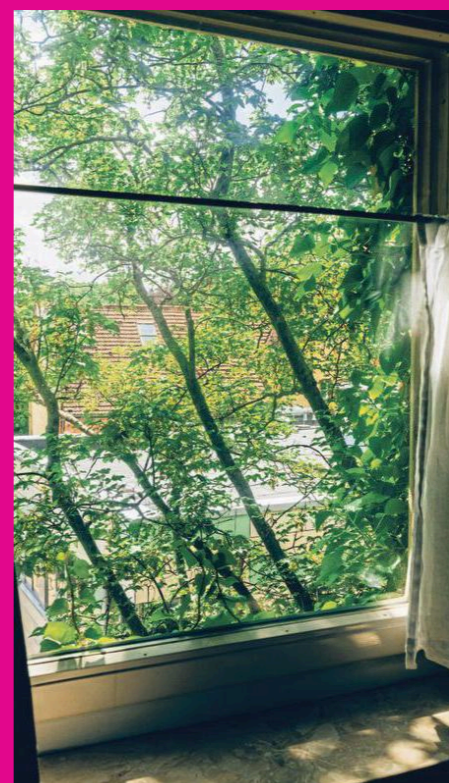
Schmieds Zimmer: Von seinem Fenster im Wohnheim in Altona aus blickt er auf hohe Bäume