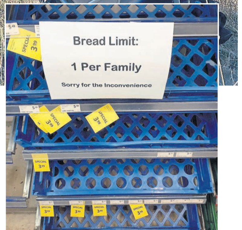
Begrenzte Ausgabemengen in den Supermärkten.

Derweil beschwört Jacinda Ardern den gemeinsamen Kampf gegen den Virus: „Unite against CoVid 19“ erscheint täglich im Fernsehen und auf doppelseitigen Anzeigen in Zeitungen. Dazu die Corona-Internetseite der Regierung und die kostenlose Hotline. Ardern eröffnet einen persönlichen CoVid-19-Livestream und erklärt geduldig, ganz ohne Manuskript, was es mit der Social Bubble (Sozial-Blase) auf sich hat, wer wofür doch sein Auto nutzen darf und wo