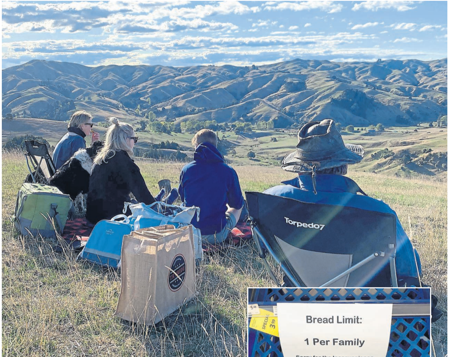
Frische Luft und weite Sicht: Diese Familie genießt während des landesweiten Lockdowns in Neuseeland den Ausblick bei einem Spaziergang auf ihrer eigenen Farm. Auch innerhalb des Landes sind Ausflüge, Reisen und Fahrten mit Ausnahme zum Supermarkt oder Arzt zurzeit nicht erlaubt.

So früh? So streng? Manche deutsche Urlauber finden das übertrieben, sind überrascht vom schnellen und konsequenten Handeln der jungen Premierministerin. Schließlich sind doch erst 102 Coronafälle im Land bestätigt, als der Lockdown am Nachmittag des 23. März beschlossen wird. Gleichzeitig wächst bei vielen die Sorge: Was wäre wenn? Womöglich Corona-krank am anderen Ende der Welt. Wie weit kann man dem Gesundheitssystem des kleinen Landes vertrauen? Der Urlaub wird für die meisten jäh unterbrochen.