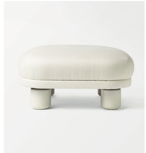
Nordische Möbel zeigen sich derzeit rundlich und solide, wie die „Famna“-Serie von Svenskt Tenn.

Kneipen sind zu teuer.“ Sie schaut auf ein Austauschjahr in Österreich zurück, in dem sie die regelmäßigen Besuche im Gasthaus mit der Gastfamilie überrascht haben: „Das haben meine Eltern mit mir nicht gemacht. Schwedische Familien laden sich gegenseitig nach Hause ein. Aber in erster Linie machen die Leute ihr Zuhause für sich selbst schön, nicht zum Herzeigen.“