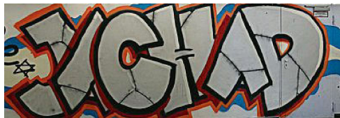
„Jachad“: das Jugendzentrum der Synagogen-Gemeinde

Die jüdische Gemeinde in Köln ist die älteste Gemeinde Deutschlands. Ihr Zentrum ist die Synagoge in der Roonstraße (links). Die orthodoxe Synagogengemeinde Köln hat 4100 Mitglieder und ist damit hinter Düsseldorf die zweitgrößte in NRW. Im gesamten Bundesland haben die jüdischen Gemeinden etwas mehr als 26 000 Mitglieder.