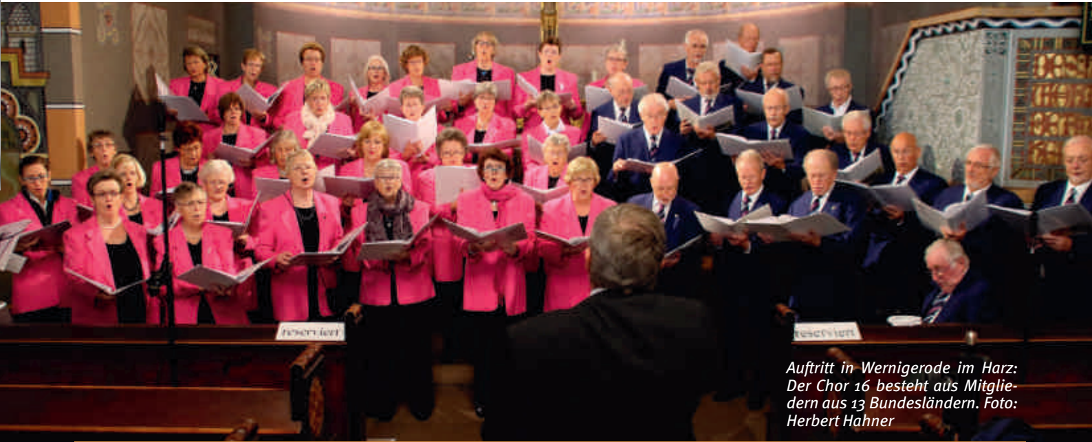
Auftritt in Wernigerode im Harz: Der Chor 16 besteht aus Mitgliedern aus 13 Bundesländern.