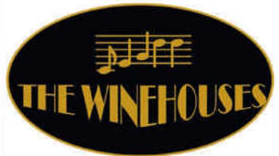
Einmal pro Woche treffen sich die Mitglieder des Popchors „The Winhouses“ zur Online-Chorprobe.