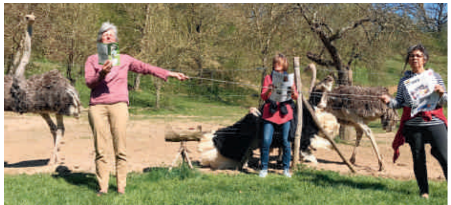
Üben mit gebührendem Abstand – oder mit MP3-Datei zuhause.