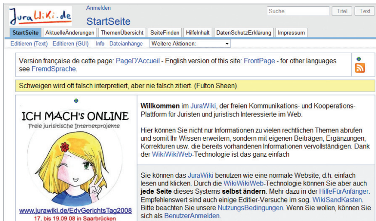
Das öffentliche JuraWiki dient als freie Kommunikations- und Kooperationsplattform für Juristen und juristisch Interessierte