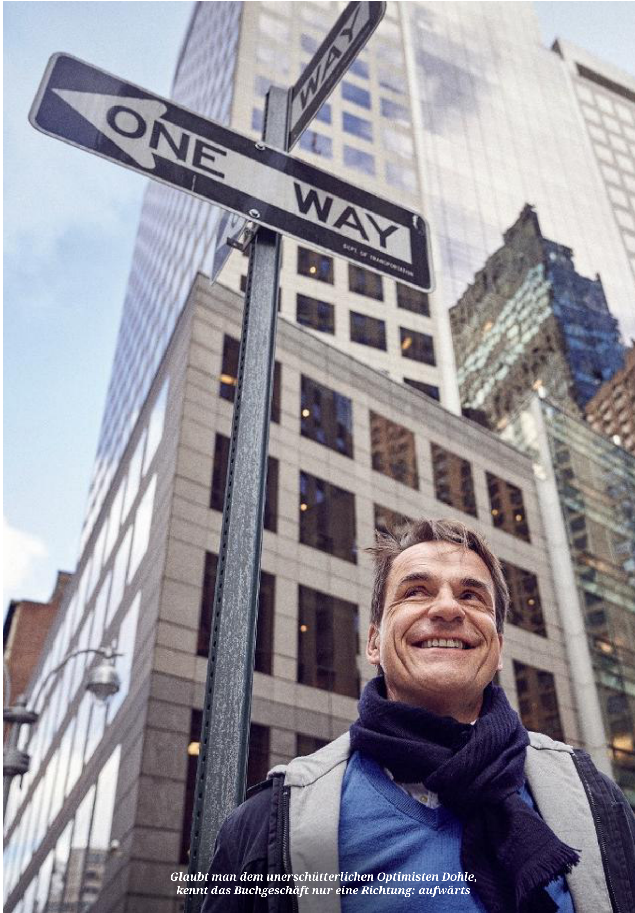
Glaubt man dem unerschütterlichen Optimisten Dohle, kennt das Buchgeschäft nur eine Richtung: aufwärts