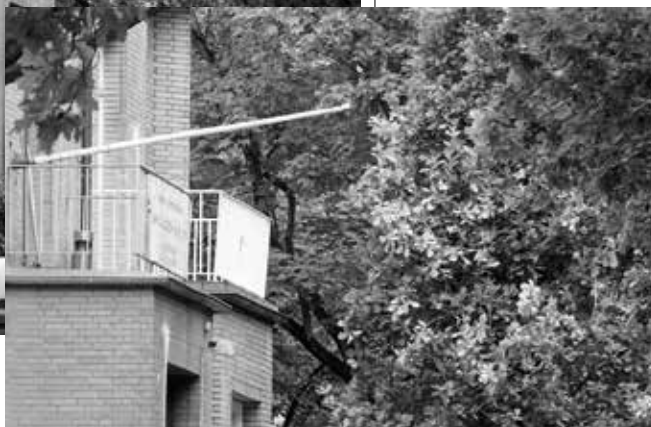
Nicht versteckt, aber wenigen bewusst: Hier trifft sich die Germania

Genau hier liegt die Gefahr, die von Burschenschaften ausgeht: Sie gehen nicht auf die Straße oder schließen sich rechten Mobs an. Sie bilden ein tiefgreifendes