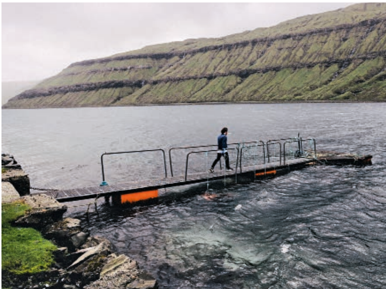
Seine Meeresfrüchte holt sich Ziska frisch aus dem Fjord (links), Beispiel rechts: Seeigel an gesäuerten Petersilienstängeln > Ziska pulls fresh seafood from the fjord (left); sea urchin with pickled parsley stems is one of the dishes served at the restaurant (right)