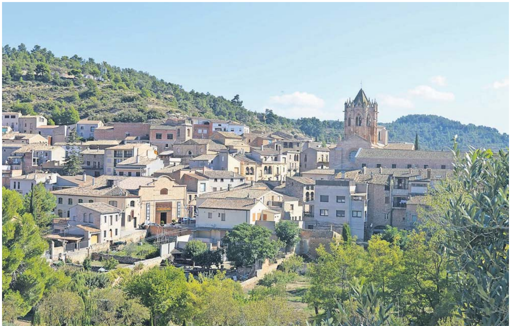
Zypressen, Olivenbäume und der Blick auf das Kloster Santa Maria de Vallbona de les Monges: Die Ruta del Cister eröffnet malerische Panoramen.

POST Otto-Hausmann-Ring 185, 42115 Wuppertal TELEFON 0202/717-2542 FAX 0202/717-2660 E-MAIL reise@wz.de