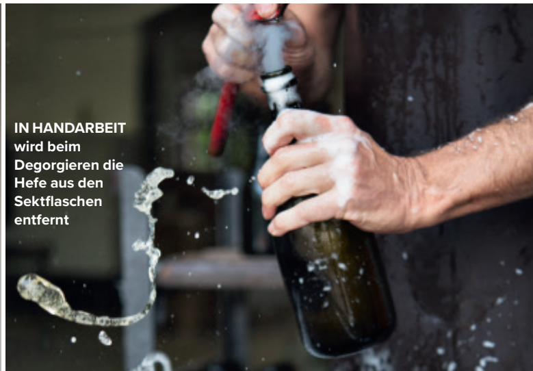
IN HANDARBEIT wird beim Degorgieren die Hefe aus den Sektflaschen entfernt