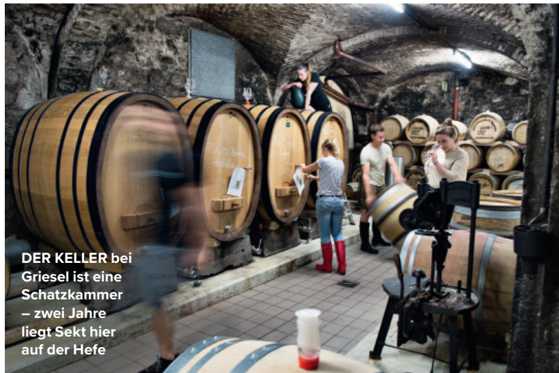
DER KELLER bei Griesel ist eine Schatzkammer – zwei Jahre liegt Sekt hier auf der Hefe