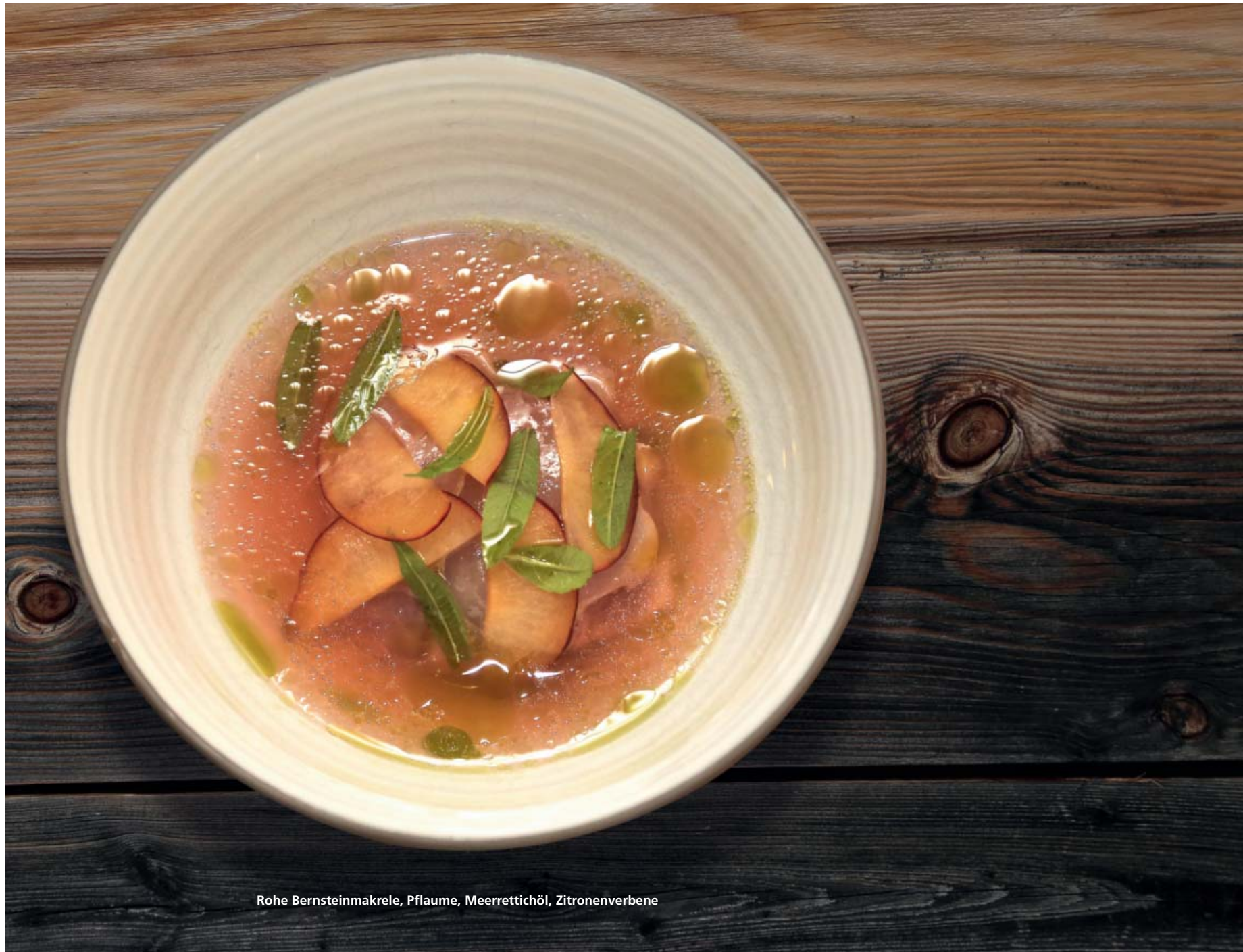
Rohe Bernsteinmakrele, Pflaume, Meerrettichöl, Zitronenverbene