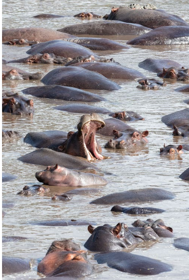
Gemeinsam am Faulenzen: Um sich vor den UV-Strahlen der Sonne zu schützen, verbringen Flusspferde die Tage im Wasser – und kommen erst nachts raus

Bahati ist Swahili und bedeutet: der Glückliche. ■