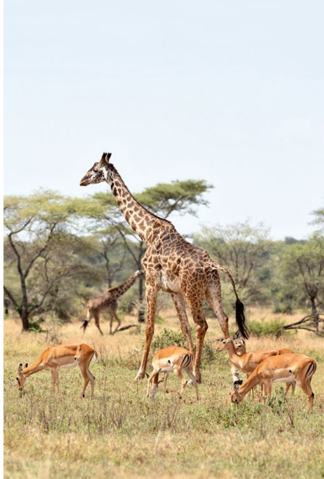
Riesen zwischen Winzlingen: Zwei Giraffen ragen aus einer Herde Gazellen heraus, die friedlich gemeinsam grasen

Es kann eine Stunde und mehr vergehen, bis sich die Katzen zeigen. Vielen dauert das zu lang. Wenn dann noch das Funkgerät knackt – »Elephant, Elephant!« –, röhren Motoren, und von den Jeeps bleibt nur ihr Profil in der rotbraunen Erde zurück. Bahati wartet. Und endlich, eine ewige Stille später, streckt sich die Leopardin, macht sich lang und springt aus dem Busch auf einen Felsen. Es hat aufgehört zu regnen, die Sonne bricht durch die Wolken und lässt ihr geflecktes Fell schimmern – und mit einem Hops, noch nicht ganz so elegant wie der der Mutter, folgt ihr Junges. Wo ist das zweite, das sie hatte? »Ja, das zweite?«, überlegt Bahati. Vielleicht hat es es nicht geschafft.