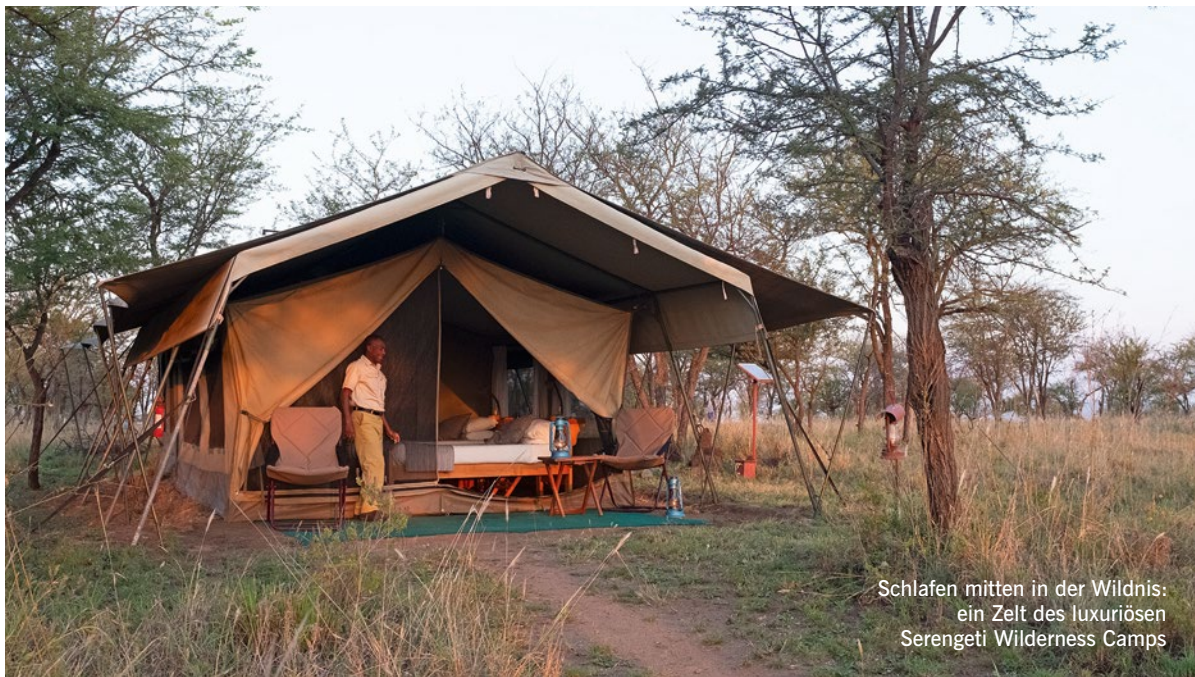
Schlafen mitten in der Wildnis: ein Zelt des luxuriösen Serengeti Wilderness Camps