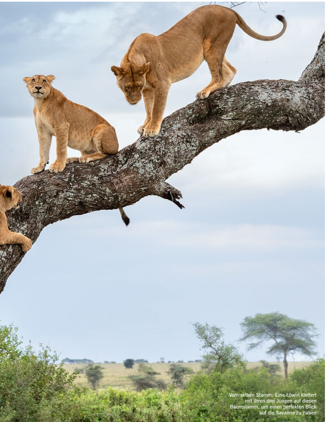
Vom selben Stamm: Eine Löwin klettert mit ihren drei Jungen auf diesen Baumstamm, um einen perfekten Blick auf die Savanne zu haben