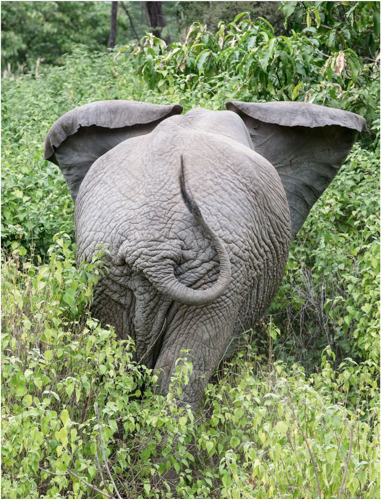
Manches Tier schert sich herzlich wenig um die Touristen in den Jeeps und zeigt ihnen nur die kalte Schulter. Oder wie dieser Elefant gleich das Hinterteil