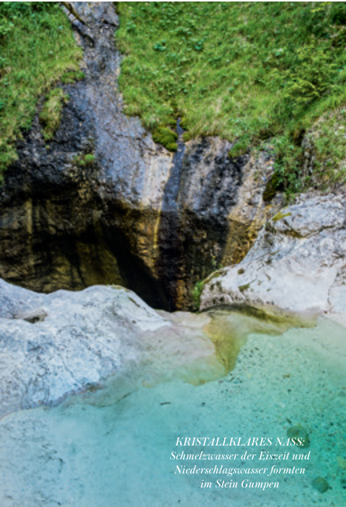
KRISTALLKLARES NASS: Schmelzwasser der Eiszeit und Niederschlagswasser formten im Stein Gumpen

Blütenschirmen vorbei, streift üppig wuchernde Farne, lässt zartblütige Akeleien und Tollkirschengewächse an sich vorüberziehen, stoppt plötzlich und meint: „Schau, eine Distel! Wer labil ist und sich unausgeglichen fühlt, sollte in die Nähe von solchen Schutzpflanzen wie Brennesseln oder Stachel- und Dornenpflanzen gehen. In ihrer Aura wird ein Schutzmantel übertragen. Das unterstützt uns in schwierigen Situationen dabei, auf unsere eigene Kraft zu bauen. Die Mariendistel hat aber auch viele heilsame Wirkungen. Sie stärkt das Herz, hilft bei Verdauungsproblemen und senkt Fieber.“