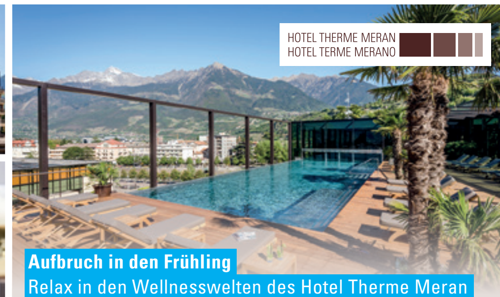
HOTEL THERME MERAN HOTEL TERME MERANO